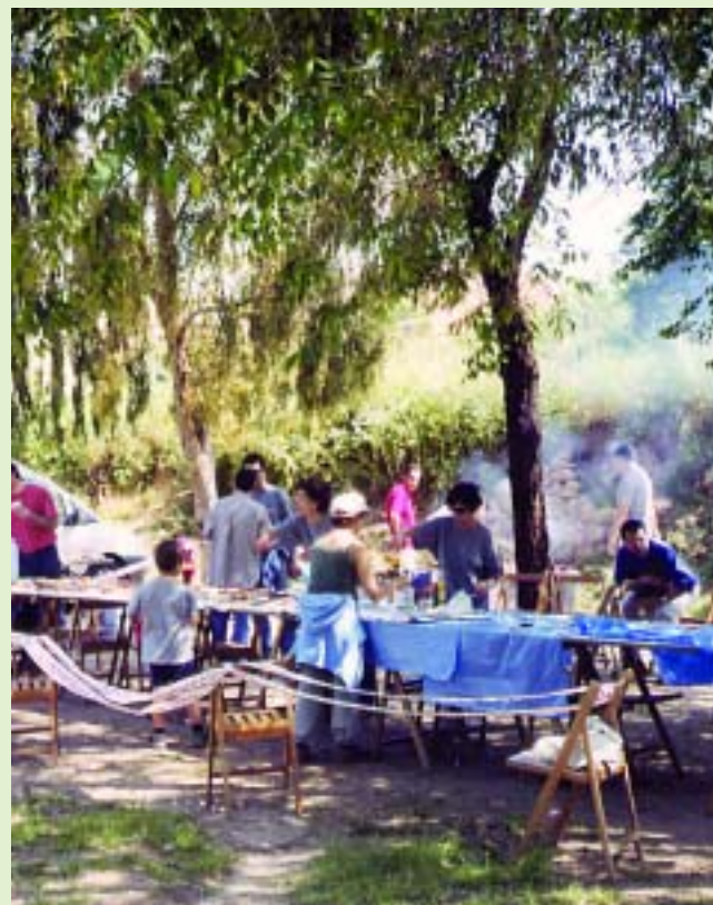
Els participants al Bosc "D'en Blanc"

El passat 16 de maig el Grup Excursionista del Papiol va celebrar una nova edició de la Caminada Popular. La caminada va començar, a les 7 del matí, des de la plaça Gaudi i va acabar al Bosc "d'en Blanc" on tots els participants van gaudir d'un merescut esmorzar.