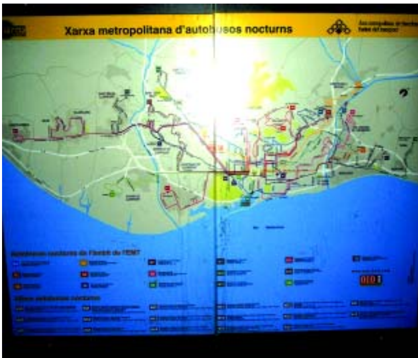
Xarxa metropolitana d'autobusos nocturns