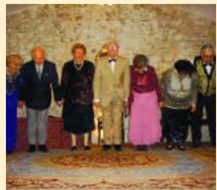
24 d'abril de 2004. 20.00h. Representació de l'obra de Santiago Russinyol "Gente Bien" a la Sala del Castell. Organitzava l'acte el Casal de Gent Gran Alexandre Figueres.