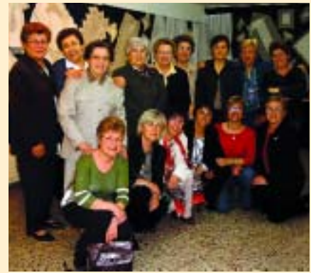
23 d'abril de 2004. 18.30h. Al Casal de la Dona s'hi van exposar una selecció dels treball realitzats.