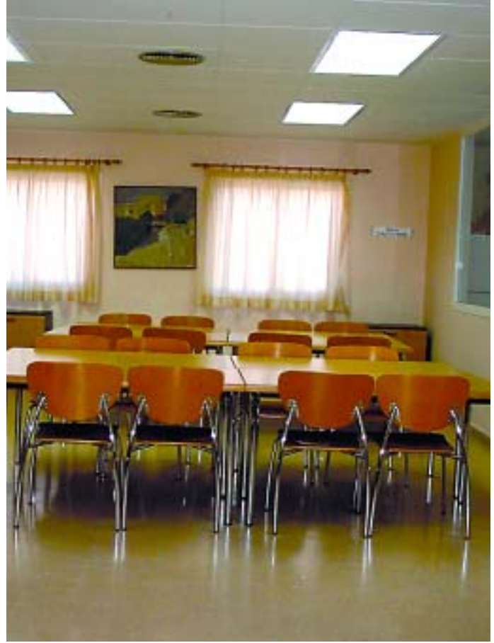
Instal·lacions del Centre de Dia

Les funcions del centre de dia són les d'acolliment i convivència, manutenció, atenció personal en les activitats de la vida diària, readaptació funcional i social, dinamització sociocultural, suport familiar i seguiment i prevenció de les alteracions de la salut. El servei del Centre de Dia Josep Tarradellas és de pagament. El preu és de 330 euros mensuals pels habitants del Papiol i de 390 euros pels no papiolencs.