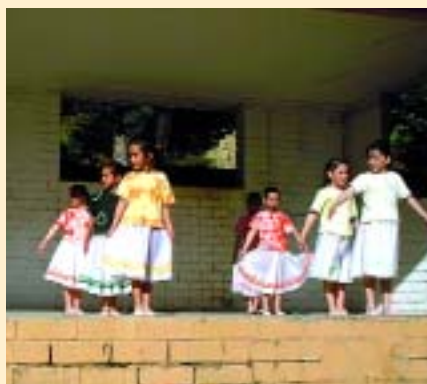
24 d'abril de 2004. 17.30h. Dansa i cançons del Ballet de l'AMPA Pau Vila a la pista del casino municipal.