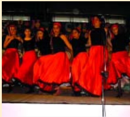
23 d'abril de 2004. 15.15h. La vetllada cultural "Pont de cultures" va tenir lloc al poliesportiu.