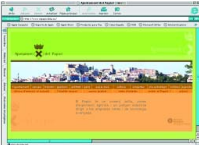
Portada de la pàgina d'Internet del Papiol

La informació sobre el nostre poble la podeu trobar ja a l'adreça d'Internet http://www.elpapiol.es . Fins ara, havíem de connectar amb la pàgina de la Diputació de Barcelona. Ara el poble ja té una pàgina independent dins la xarxa i el registre és de la seva propietat. A la pàgina web podeu consultar-hi, entre d'altres, les últimes notícies que afecten a la vida de la nostra vila així com la informació essencial del Papiol.