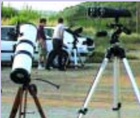
En els camps d'observacions amateurs s'hi pot veure tot un muestrari d'instrument astronòmic.

L'interès pels temes astronòmics i espacials, aquests últims anys ha pujat molt. Hi ha diverses causes que ho justifiquen: els avenços en el camp de l'astronàutica, sigui pels vols espacials o per les darreres actualitzacions en referència als descobriments duts a terme per sondes automàtiques enviades, amb més o menys fortuna, als astres del Sistema solar.