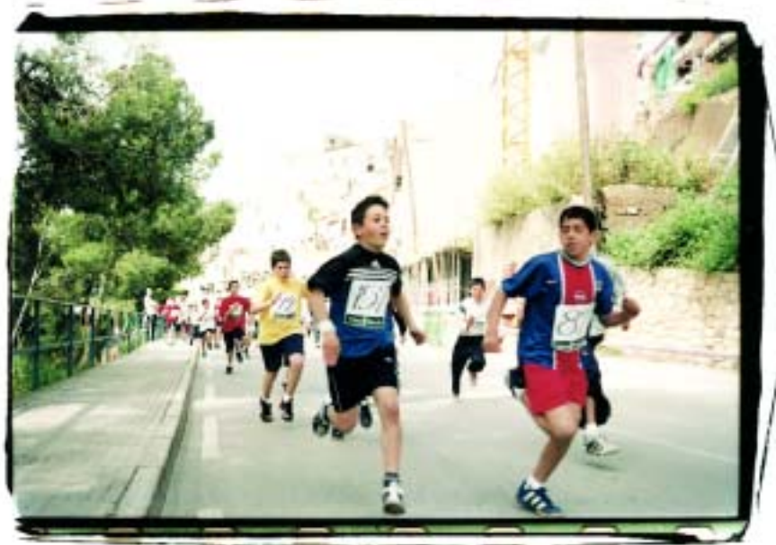
A l'inici de la cursa tots els participants eren plens d'energia

“És una cursa dura ja que al comptar amb tantes pujades i baixades i amb corbes tant tancades un no pot agafar mai el ritme, sempre està pendent dels accidents geogràfics.”