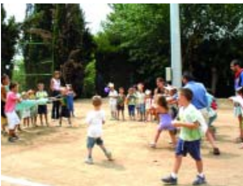
Festa Major del Papiol 2003

les vostres dades i el nº de telèfon de contacte. En el cas que hi haguessin molts joves interessats, la feina es donaria a les 6 primeres persones inscrites.