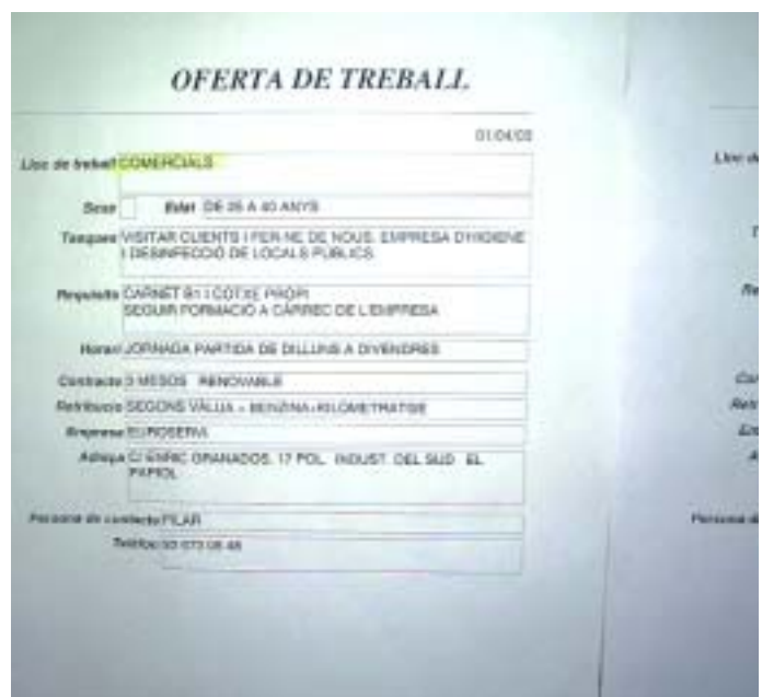
En els últims dos anys s'han duplicat les insercions laborals

En la recerca de claredat i d'acostament dels serveis municipals a la ciutadania, s'ha decidit que l'Oficina Municipal d'Informació i Orientació Professional de l'Ajuntament del Papiol (OMIOP) canviï de nom per passar a anomenar-se Oficina d'Inserció Laboral (OIL). Recordem que des d'aquesta oficina, que en els dos últims anys ha duplicat les insercions laborals, tots els ciutadans que ho desitgin poden consultar lliurement les ofertes que es gestionen des de l'Ajuntament del Papiol així com aquelles que arriben de l'OSOC (antic INEM) de Sant Feliu de Llobregat (estalviant-se d'aquesta manera el viatge a la població veïna). Alhora, també es poden consultar totes les ofertes de formació ocupacional que existeixen actualment a la comarca del Baix Llobregat. La consulta de tots aquests serveis és lliure i no s'ha de demanar hora.