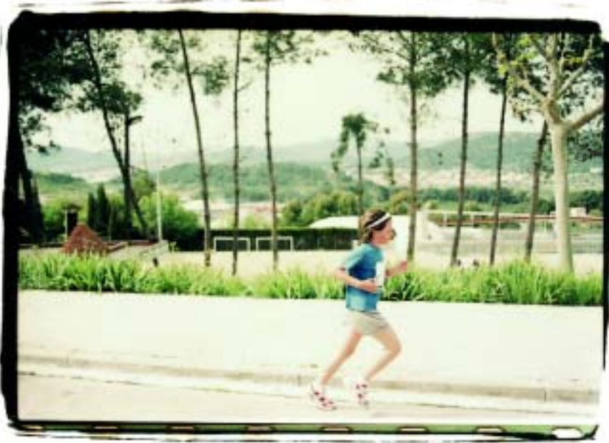
Les vistes del Papiol van acompanyar als participants durant tota la cursa

dent dels accidents geogràfics. Per altra banda el recorregut és complet, es té una visió molt bonica del poble. Això sumat a la mateixa duresa de la prova la fa, per la mateixa raó, molt atractiva.”