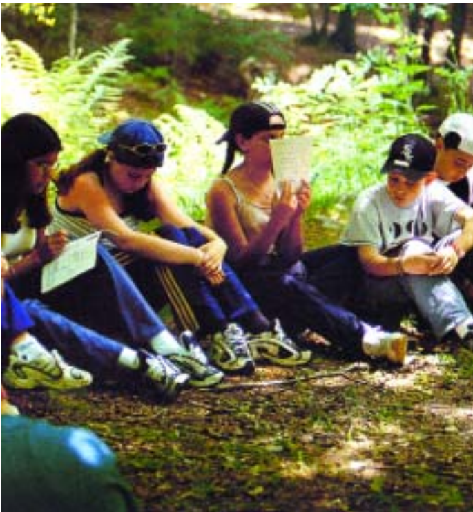
La visita als parcs naturals formen part del conveni

El conveni al qual s'ha adherit l'ajuntament del Papiol vol sensibilitzar als alumnes sobre la importància de la conservació medi ambiental. El Servei de Parcs Naturals realitza, en col·laboració amb els ajuntaments de la província de Barcelona un programa adreçat als escolars de sisè curs de primària que té com a objectius principals donar a conèixer els parcs que gestiona i també sensibilitzar els escolars de la utilització racional dels recursos naturals.