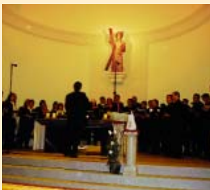
23 d'abril de 2004. 21.30h. Els membres de la coral Quodilbet van cantar a la parròquia de Santa Eulàlia.