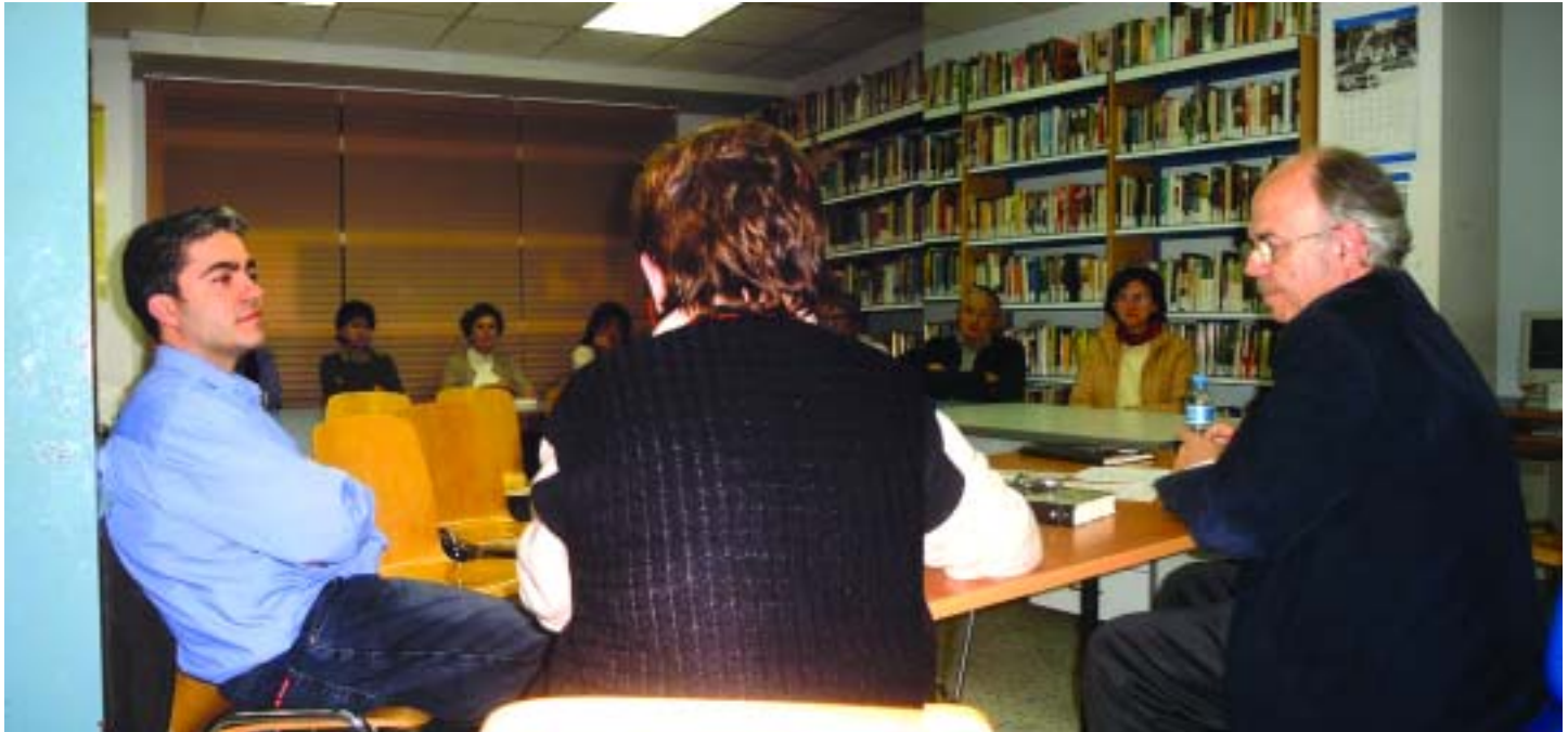
El club de Lectura organitza diverses activitats al llarg de l'any.