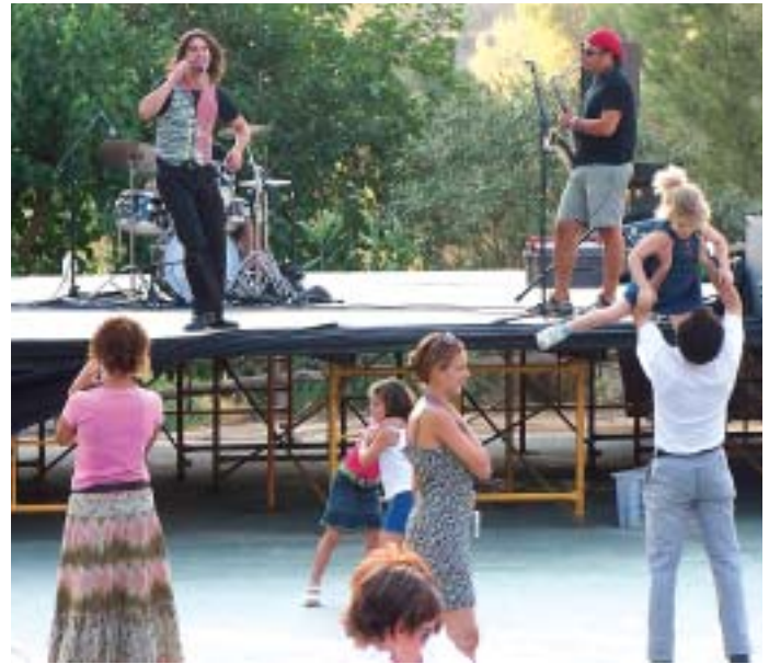
El grup Pentina el Gat va divertir als pares i els nens

Un dels actes més tradicionals, les Cucanyes de Festa Major organitzades per la penya Pirata Bu van arrebregar una bona colla d'infants al Camp de Futbol divendres al migdia. El PSC-PSOE es va encarregar d'organitzar les activitats infantil de diumenge: els tallers de manualitats, jocs inflables o una volta en quad.