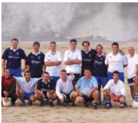
Participants del partit de futbol entre solters i casats

No van faltar esports més minoritaris com el tir amb arc, on el Club d'Arquers del Papiol van fer una excel·lent demostració del que és donar en la diana. El mateix va passar amb els participants del tir al plat, que amb les seves escopetes van fer una trencadissa, però no de porcellana, és clar.