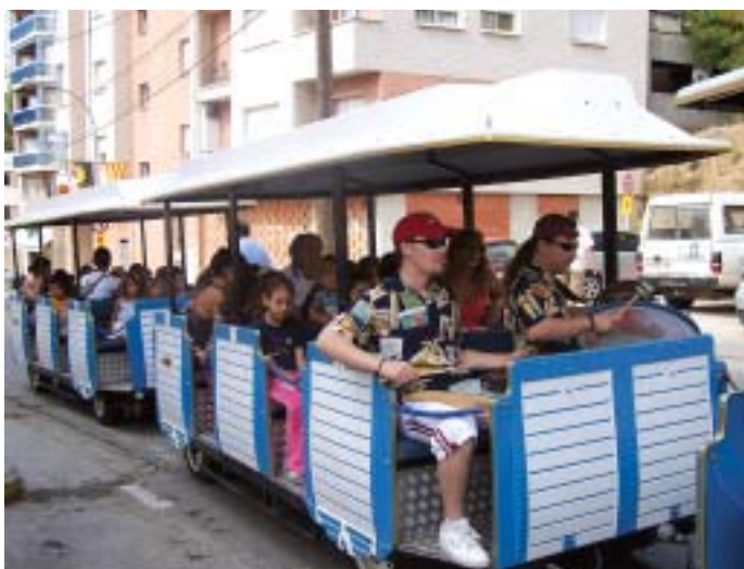
I comença la Cercavila!