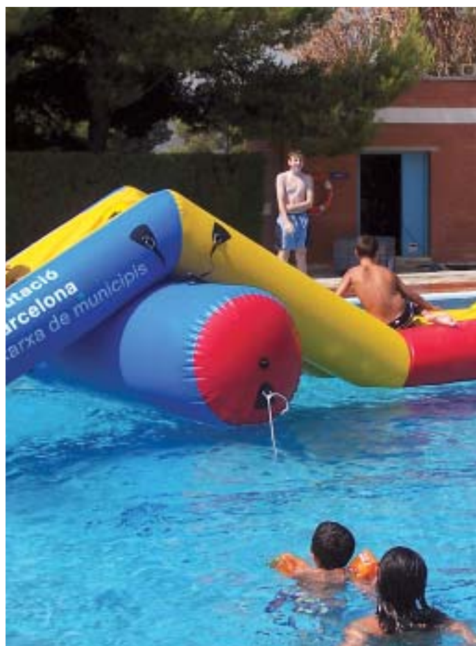
Jocs infantils a la piscina