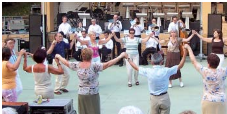
Sardanes amb la Cobla Marina

No podria passar per alt el popular Ball de Confetti, una de les cites més mítiques de cada Festa Major. Grans i petits, gairebé tot el poble, es va reunir el dissabte a la nit al Casino per disputar una amistosa baralla amb confetti a ritme de música, la qual va anar a càrrec de l'Orquestra Bossanova.