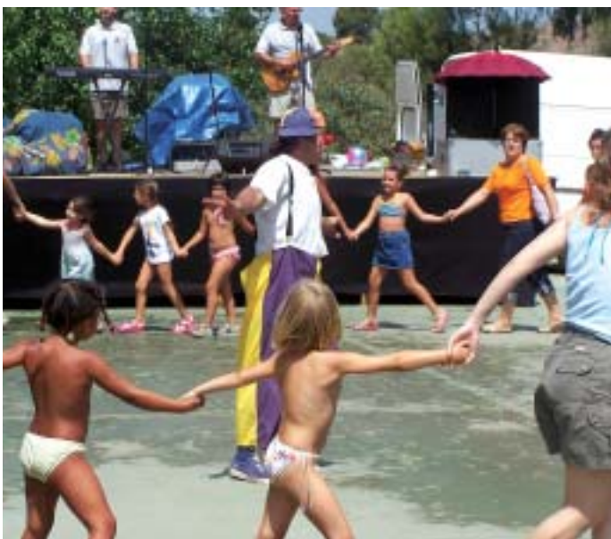
El grup Amadeu & Cia va fer ballar a grans i petits