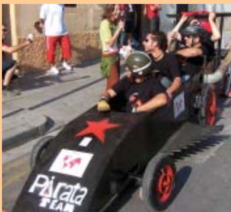
El Tercer Premi va ser per als "Pirata Team"