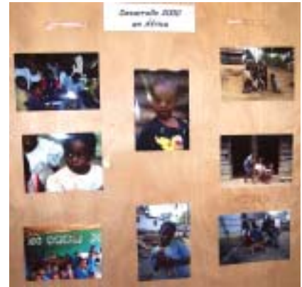
L'exposició sobre l'Àfrica

L'exposició "Jocs del Món" ofería una mostra de jocs de diferents cultures i èpoques ordenats segons quina és l'acció bàsica: xutar, girar, agafar, tombar, etc. A més, comptava amb una secció destinada a jocs alternatius, i una altra per a jocs tradicionals com la baldufa, les bales o la xarranca. Entre els joc més internacionals s'hi podia trobar el Table Skittles: un joc anglès de bitlles de taula; el Crokinole, un joc originari del Canadà, o el Carrom, un joc de taula practicat a l'Índia i el lemen. L'exposició sobre l'Àfrica estava basada en