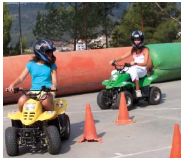
El pati de l'escola també es va convertir en una pista de karts