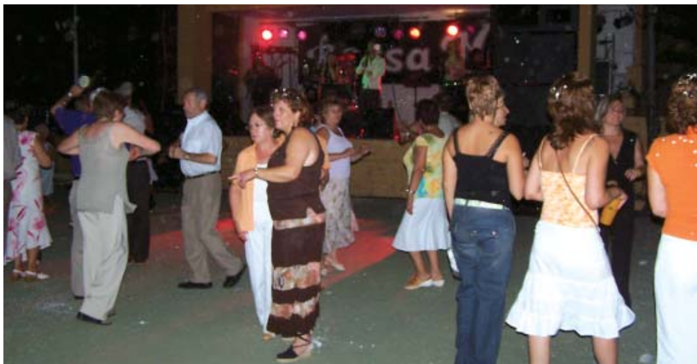
El Ball de Confetti, l'èxit de cada any