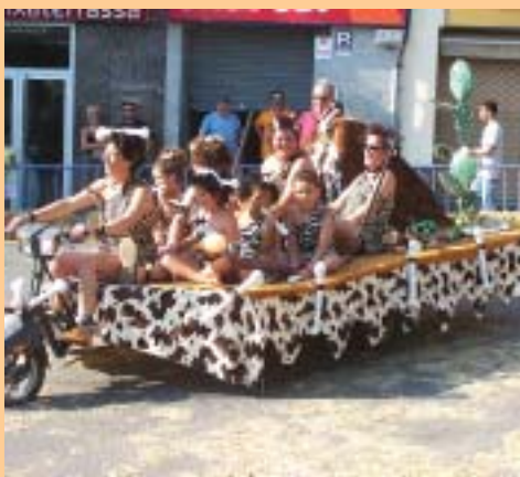
"Les Pelandrusques", guanyadores del Primer Premi