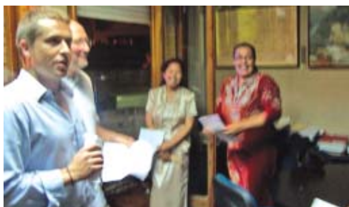
Distensió abans de sortir al balcó