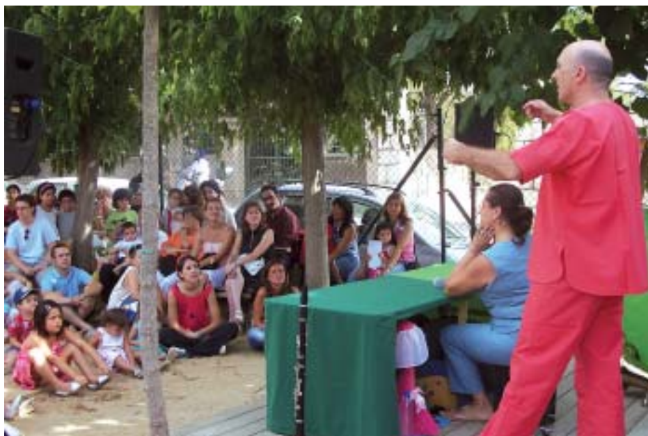
"Contes que sonen", a càrrec d'El Toc de Retruc

Dijous 28, El Toc de Retruc va ser el grup encarregat de l'activitat que va "engegar" la festa amb els seus "Contes que sonen", que van deixar pares i fills embadalits amb les seves històries. El pati de l'Escola Bressol El Cucut no va ser l'únic escenari per als