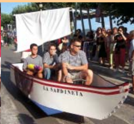
La Sardineta, la barca amb rodes