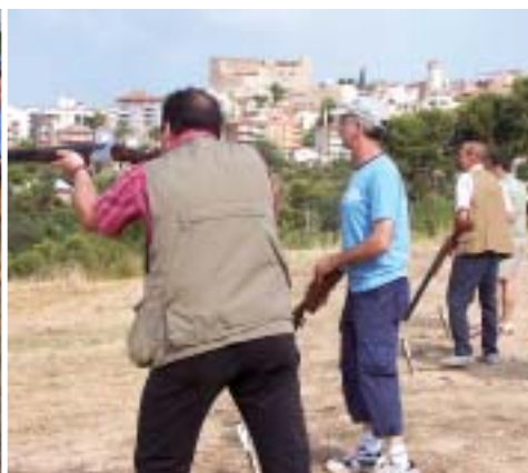
Torneig de tir al plat