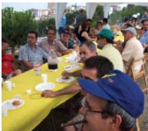
Abans de l'exhibició... un bon esmorzar