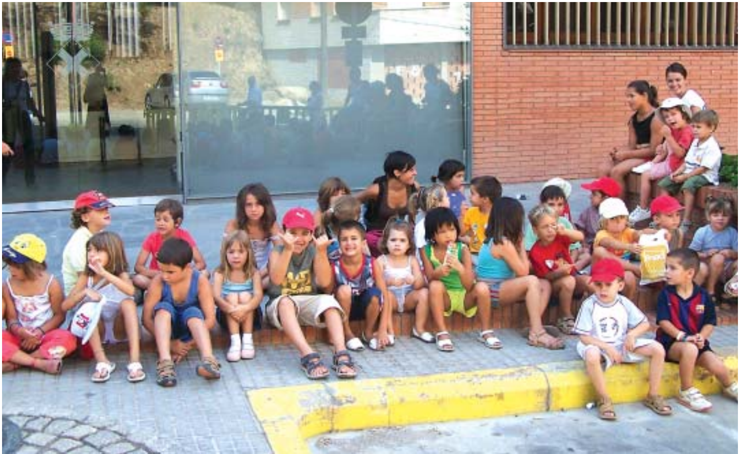
Els nens dels Casals d'Estiu esperen impacients l'arribada del trenet

van donar-li el toc festiu. A cançons típiques de xaranga se li van sumar èxits musicals com "Color Esperanza", del cantant Diego Torres, i peces tradicionals com "La gallina Turuleta" o "Hola don Pepito" que van despertar als més dormilegues a les deu del matí.