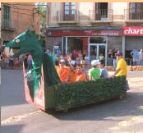
El Dragon Khan de la penya Farigola