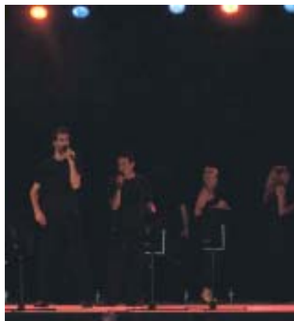
El grup Diapaswing, novetat d'aquest any