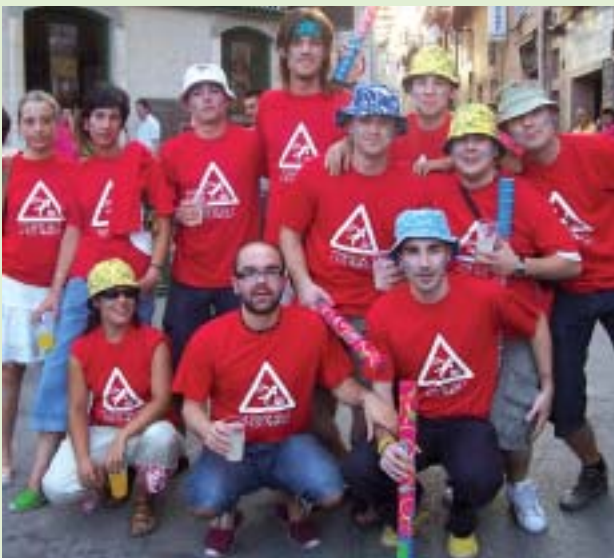
Una altre de les penyes del poble