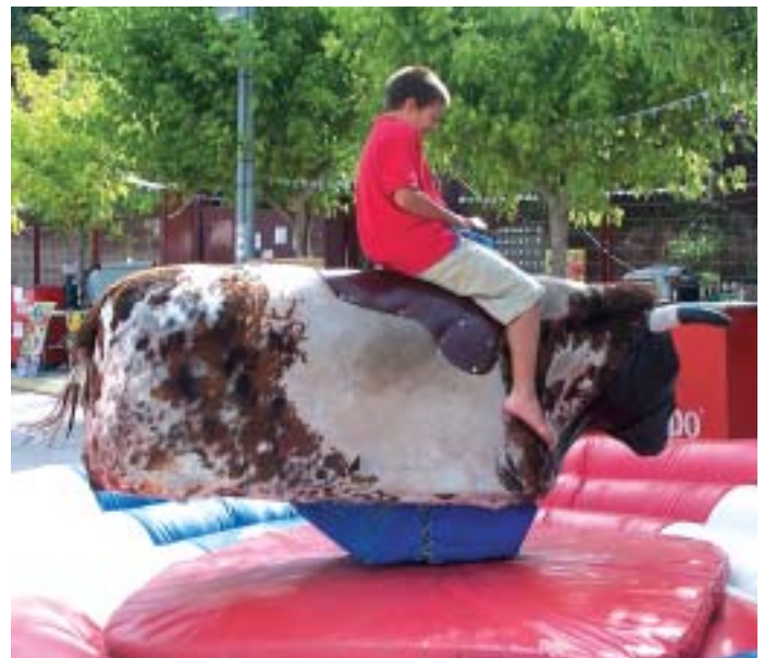
Jocs per a infants al pati del CEIP Pau Vila