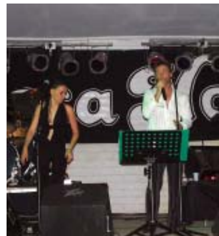
L'Orquestra Bossanova animà el Ball de Confetti