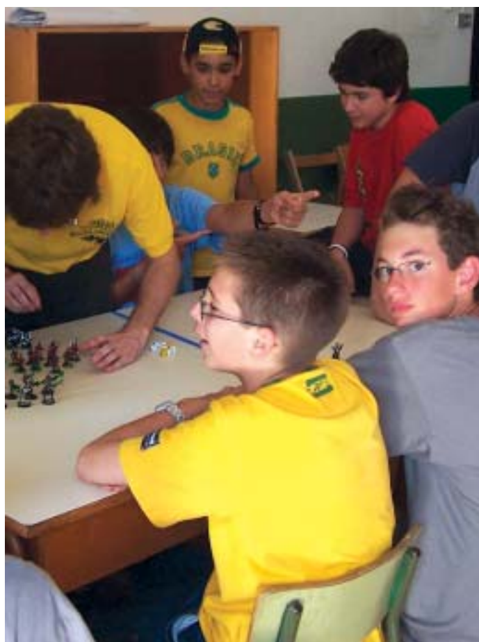
La demostració de Warhammer va reunir una bona colla de nens

tratègia inspirat en móns fantàstics, on les peçes havien estat pintades a mà en anteriors tallers pels mateixos jugadors.