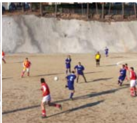
Campionat de Futbol entre el Papiol i el Vallirana