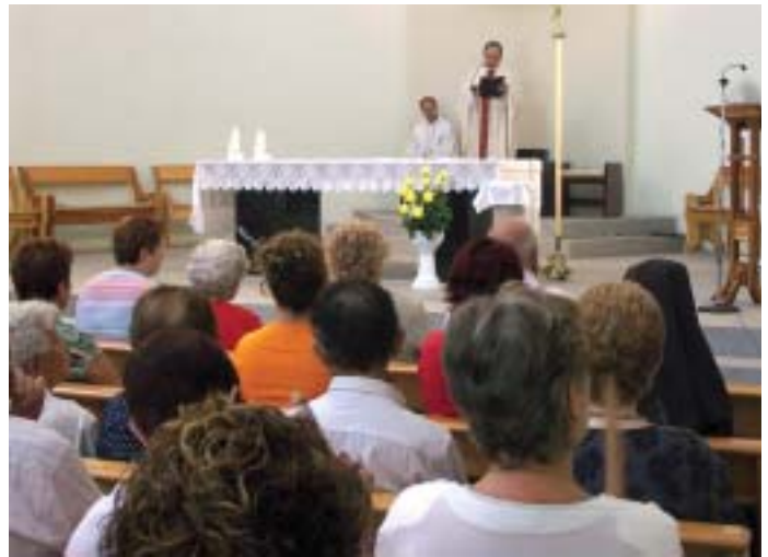
Un moment de la cerimònia

Dins dels actes més tradicionals, la Missa de diumenge de Festa Major és un esdeveniment que segueix congregant molts papiolencs i papiolenques.