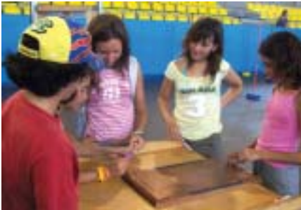
Un dels jocs de l'exposició "Jocs del Món"

El Pavelló Municipal d'Esports va estar ocupat per dues exposicions ben interessants: Jocs del Món i Àfrica.