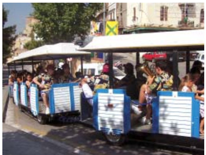
El trenet arriba a la Plaça Gaudí