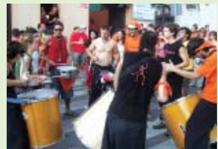
Improvísada batucada entre algunes penyes

La seva espontaneïtat i les ganes de festa formen un còctel explosiu que porta la gresca allà on sigui. Activitats com la nit de penyes -on van participar-hi totes-, el dinar de germanor -organitzat per la Penya Piratabu-, la ruta de la cervesa -promoguda per la Penya Orange-, el despertar matiner i la xocolatada -a càrrec de la Penya Ekipo- i l'exitós estirar la corda -organitzat per la Penya Despertaferro- van estar organitzades per les existents al poble.