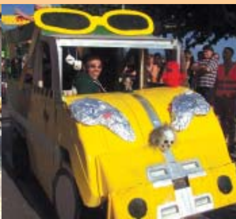
Els "Papineng", es van emportar el Segon Premi