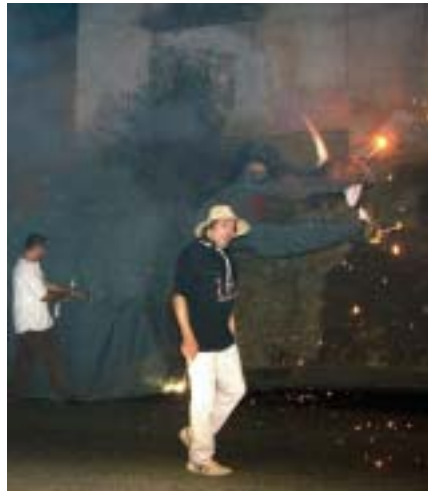
El Cavall Armat, símbol del poble

El Cavall Armat va tornar a ser protagonista, un any més, del Correfoc del Papiol. El símbol de les gestes amb les que el poble del Papiol va participar al llarg de l'Edat Mitjana va compartir el foc i els petards amb els Diables del Papiol i la secció Timbalers i Grallers de l'Associació Empenta Cultural. Prop de tres-centes persones van apropar-se al Correfoc del Papiol per gaudir una estona d'una de les activitats més tradicionals de Catalunya.