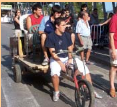
El vehicle més rural de la Baixada