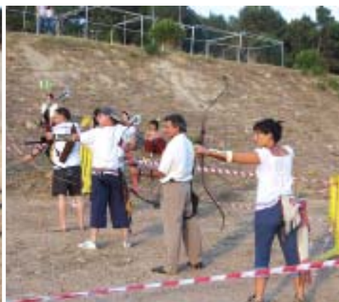
Exhibició de tir amb arc