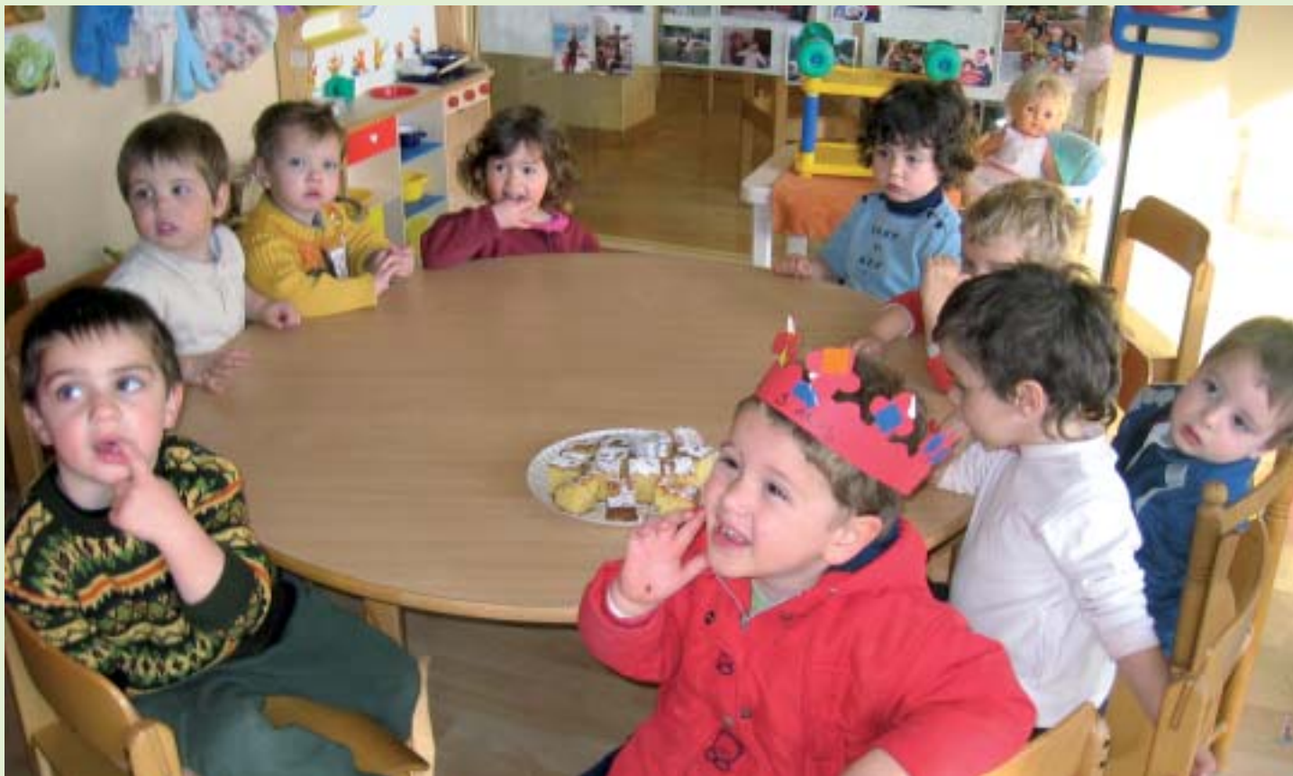
L'hora del berenar a l'Escola Bressol

L'Escola Bressol és el primer cycle de l'etapa infantil, que té continuïtat a l'escola primària. Hi acollim nens des dels primers mesos de vida fins als tres anys.