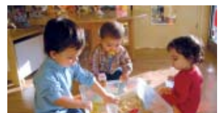
Jugar i aprendre