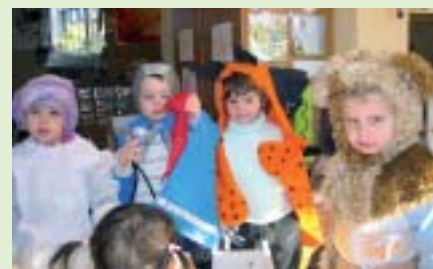
Disfresses per a tots

prendre el món que l'envolta. És per això que amb il·lusió, intentem dur a terme aquesta tasca oferint al nen tota una colla de propostes de joc, de contes, de titelles, de disfresses, etc. que tenen com objectiu ajudar al nen durant el seu procés maduratiu. A tot això també hi hem d'afegir una actitud molt acurada a l'hora de les situacions de cura del nen com pot ser l'estona del dinar, de canvi de bolquers, de control d'esfínters i també a l'hora de posar-lo a dormir i llevar-lo de la migdiada, ja que són moments privilegiats on la relació amb l'adult és més personalitzada. L'escola bressol del Papiol té una cabuda màxima de 61 infants i aquest any hi ha pogut entrar tots els infants que ho han sol·licitat quedant quedant fins i tot algunes places lliures. La Generalitat ha volgut premiar amb