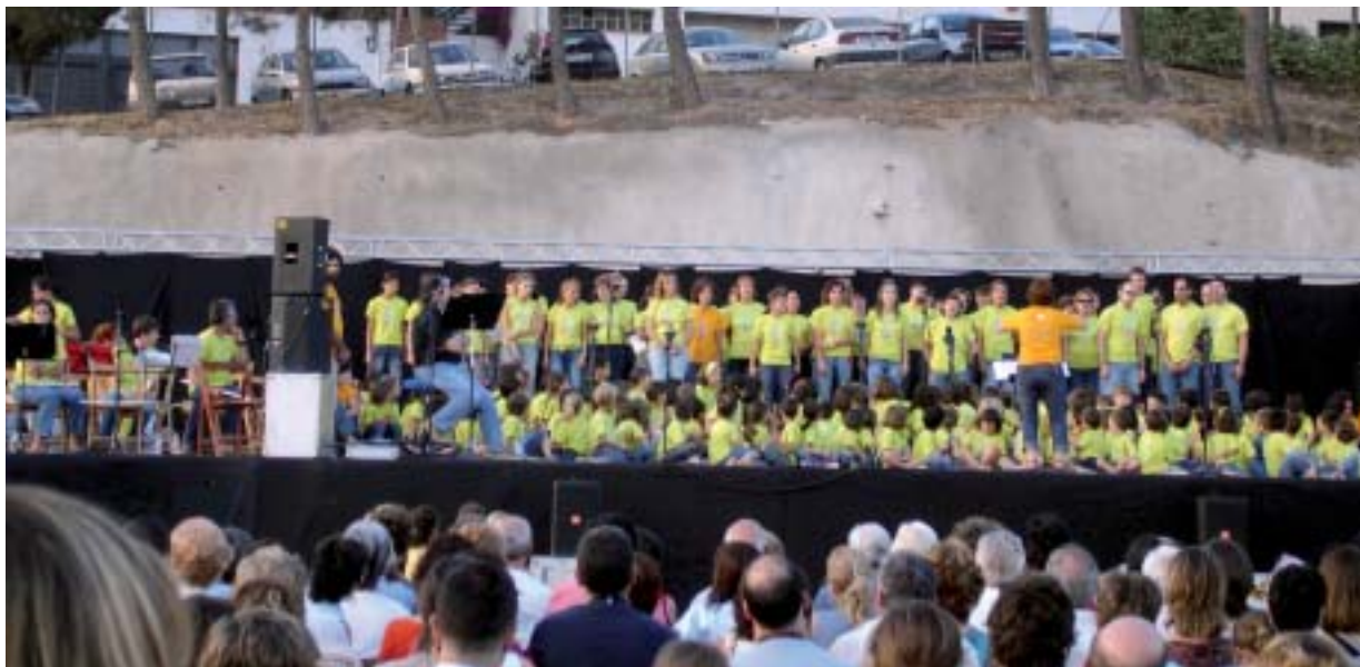
Més de 500 persones van assistir al concert de la cantata