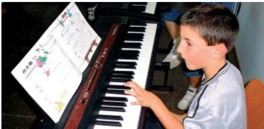
Un alumne de l'Escola de Música a classe de piano

L'Ajuntament, seguint l'objectiu de potenciar, desenvolupar i enfortir l'aprenentatge musical al Papiol, ha posat a disposició dels alumnes de l'Escola de Musica Miquel Pongiluppi dues beques amb una dotació del 50% de l'import del programa d'estudis.