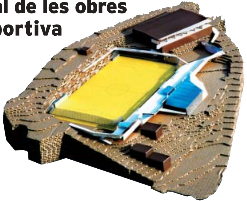
Maqueta de la nova zona esportiva del Papiol

El complex de piscines del que podrem gaudir a partir del proper 2007 compartirà amb un petit spa de 6 metres x 6 metres; una piscina d'iniciació de 14 metres x 6'5 metres, on s'hi faran les activitats de aquagym i on els petits podran començar a nedar i una piscina de 25 metres x 8'30 per als més grans. Aquest complex gaudirà d'una coberta retràctil que deixarà a l'estiu la piscina gran descoberta. A l'hivern les dues estaran protegides del fred.