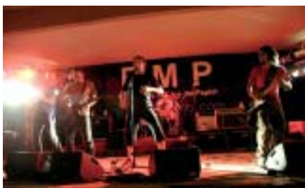
Actuació de "De cara a la pared"

El primer cap de setmana de juliol el nostre poble va ser l'escenari privilegiat dels músics que van participar a la segona edició del FMP on hi van acudir prop de 500 persones tant del poble com de poblacions veïnes. Entre d'altres van poder gaudir dels grups Love of Lesbian , de l'actuació sorpresa d'Antonio Orozco fent un duet acústic molt celebrat amb Pedro Javier Hermosilla, i també, com no, dels vuit grups que participaven a la finalíssima. Entre els presents van destacar