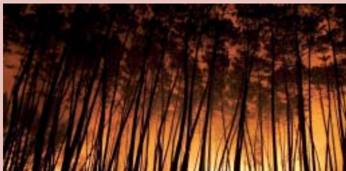
El foc pot crear autèntics desastres

En cas de detectar un incendi truqueu als Bombers (085) o als serveis d'emergències de la Generalitat (112).