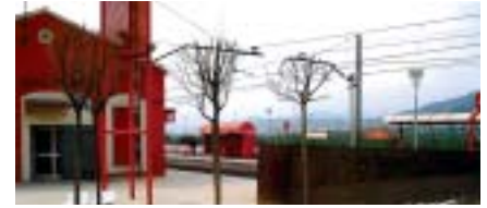
Estació de Renfe

La construcció d'aquest pas inferior, una reivindicació de molts papiolencs i papiolenques al llarg dels últims anys, comptarà amb dues escales i dos ascensors.