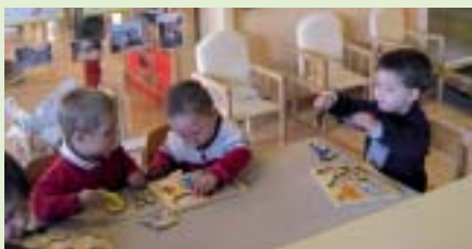
Dins d'una aula

Tenim molt clar que la denominació "guarderia" no s'adequa als nostres objectius, perquè creiem que la llar no és només per "guardar" canalla, sinó que serveix per ajudar a l'evolució del nen i ajudar-lo a com-