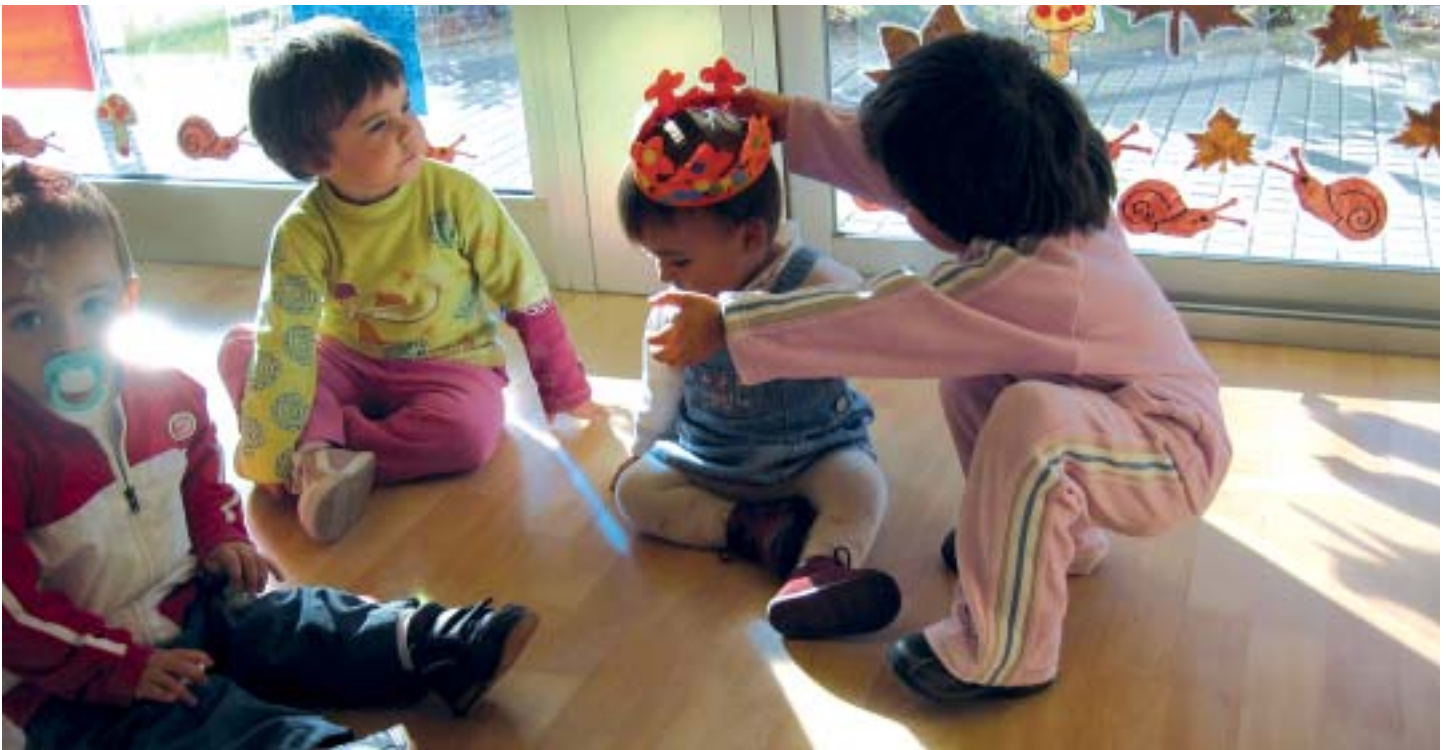
Els nens i nenes troben un espai per conviure amb infants de la seva mateixa edat