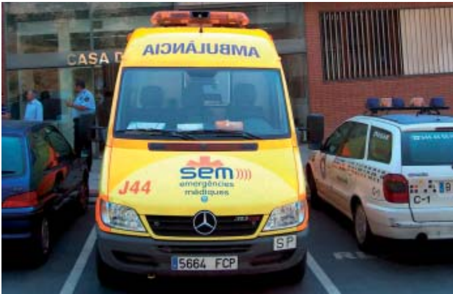
L'ambulància aparcarà davant l'Ajuntament

Una ambulància d'última generació està a disposició de tots als Papiolencs per respondre a qualsevol urgència des de l'1 juliol. L'ambulància del Sem (el Servei d'emergències mèdiques) tindrà la seva base al Papiol, de vuit del matí a vuit de la tarda, i estarà aparcada a l'entrada de l'Ajuntament, al costat del Dispensari Municipal.