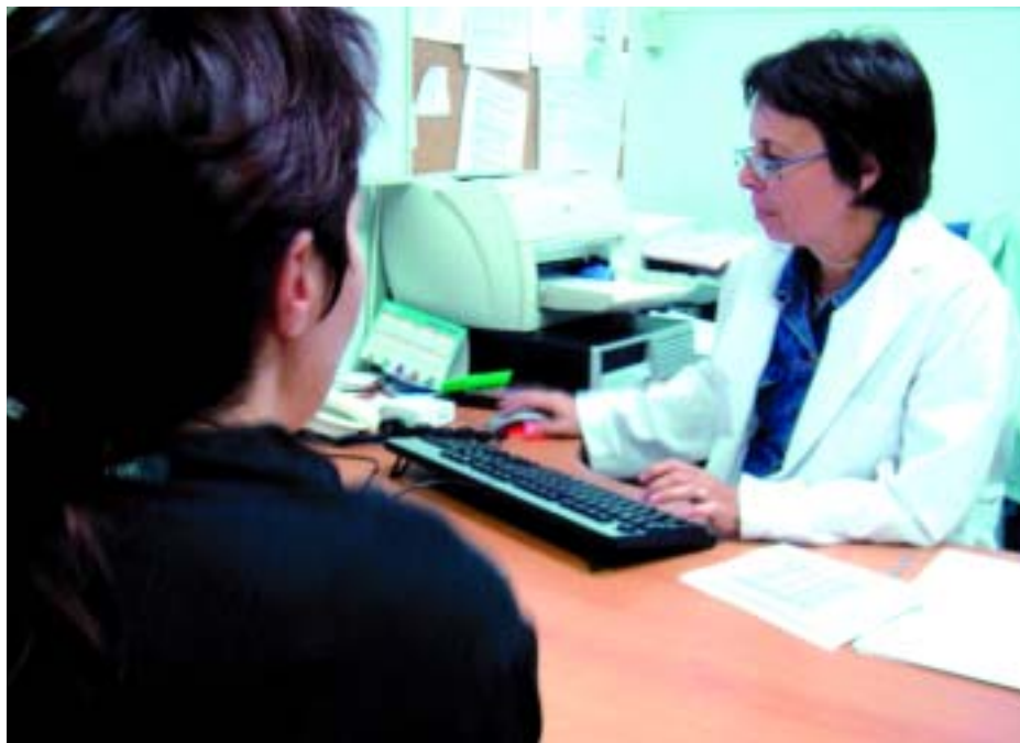
La nova metgessa del dispensari atèn a una pacient

També s'ha consolidat el programa d'atenció domiciliària (ATDOM) que ha