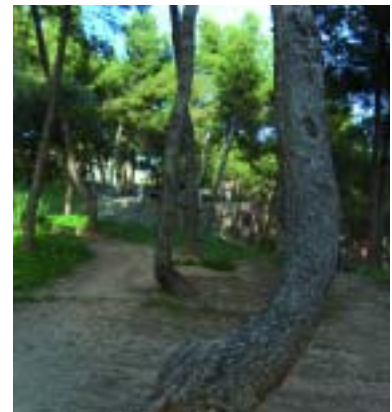
Estat actual del parc

drats. Aquesta serà, per una banda de tractament vegetal. S'hi plantaran diverses espècies i s'hi construiran una mur de pedra armats menys impactants i menys agressius pel propi medi natural. A més a més, es recobriran d'heura. La intenció és donar una imatge agradable d'espai verd. Alhora, per altra banda, s'ampliaran les voreres de les dues bandes, es crearan nous recorreguts de connexió i es crearà una nova illa per a l'ús lúdic dels nens petits.