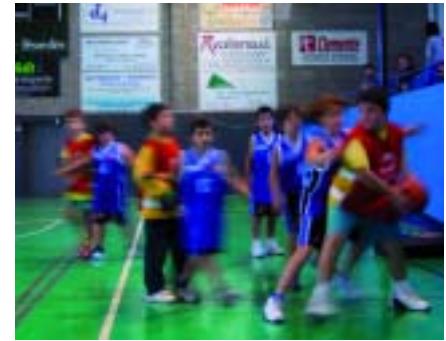
Entrenament de l'equip de bàsquet

Aquesta temporada l'Esport Base del Papiol compta amb 12 equips esportius, 5 de bàsquet, 2 de futbol, 3 d'handbol i 2 d'iniciació esportiva. Les inscripcions son obertes amb la finalitat de que tots els nens i nenes del Papiol en edat escolar puguin practicar activitat física i esport amb nosaltres.