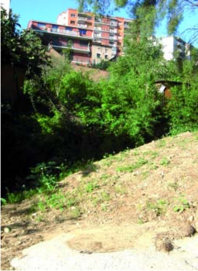
L'antiga riera ha passat a ser part del clavegueram municipal

De les tres cues de clavegueram que quedaven per a arreglar al poble l'Ajuntament ha acabat d'arranjar-ne una, la més problemàtica, costosa i que més afectava a la població. Les dues que queden passen pel costat dels habitatges i la que s'ha arreglat per sota, pel que afectava negativament i de forma directa la vida d'alguns veïns. Tres habitatges patien, de fet, un canal d'evacuació d'aigües brutes de més de 300 cases. En