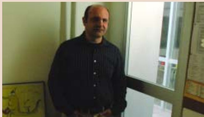
El director de l'escola Pau Vila al seu despatx

"En reunió del consell del dia 5 d'abril de 2006, vam valorar que la implantació de la 6ª hora ha de donar qualitat i prestigi a l'escola pública i que, com la mesura pretén en primer lloc, possibilitarà la igualtat d'oportunitats i l'equitat educativa en tant que iguala el número d'hores de l'escola pública amb la concertada. Amb el nostre pesar, vam considerar, també, que aquesta 6ª hora s'està implantant de manera molt precipitada per poder garantir l'aplicació amb un mínim de qualitat.. La mateixa Administració educativa, davant