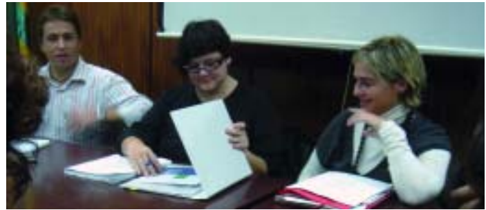
Reunió de presentació de la ràdio als interessats del poble en col·laborar