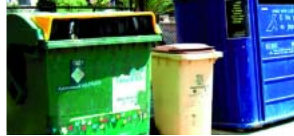
Contenidors de reciclatge del Papiol

Així doncs, per tal de millorar la participació de la població i recuperar molts més residus, l'Ajuntament del Papiol ha engegat una campanya de reforç de la recollida selectiva de la brossa orgànica, que es centra la importància en separar-la correctament (sense bossa de plàstic, ni altres materials inorgànics que la puguin contaminar) i deixar-la al contenidor beix amb tapa marró.