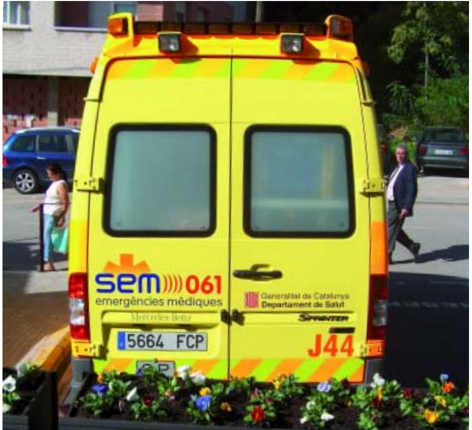
L'ambulància del SEM a l'aparcament de davant de l'ajuntament

Els alcaldes del Papiol i de Molins de Rei, es van reunir amb la consellera de Sanitat de la Generalitat, el mes de març de l'any