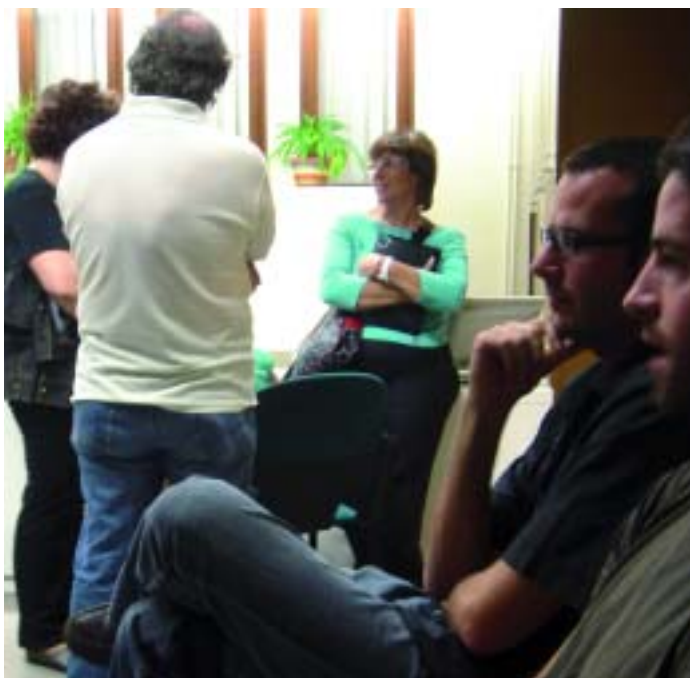
Alguns dels interessats en col·laborar van reunir-se al saló de plens

que es farà són diferents. Sobretot, no es vol començar la casa per la teulada. La radio ha de anar creixent a poc a poc. La feina de la productora -prosegueix Dinarès - es la de posar les eines perquè els papiolencs i papiolenques puguin fer la radio que volen i, també, la d'ajudar a dinamitzar el poble".