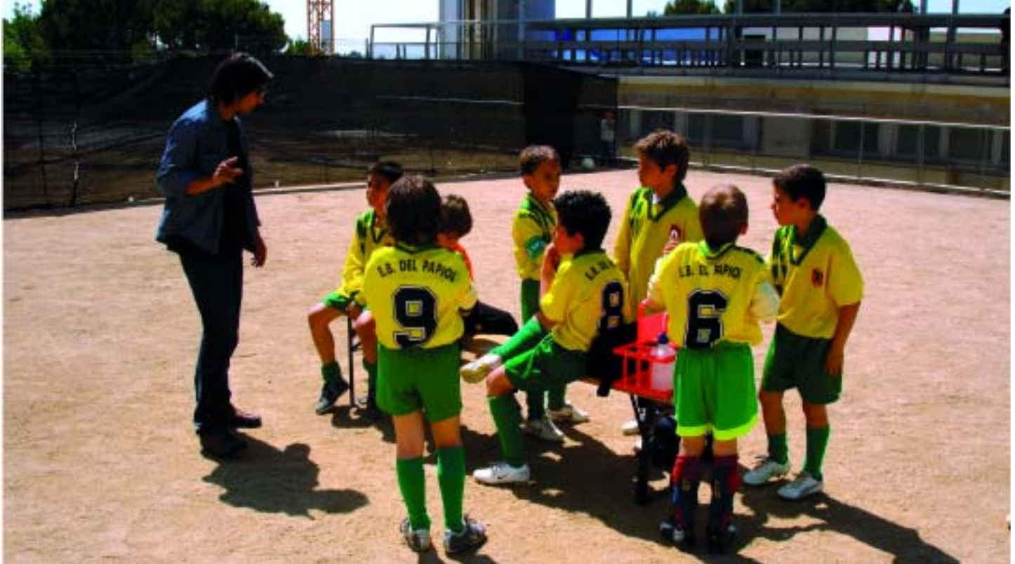
L'esport base del Papiol prepara els seus integrants en futbol, handbol i bàsquet