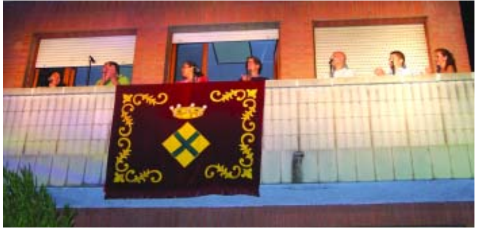
Un moment del pregó de 2005 on els immigrants van tenir el protagonisme

El Pla no vol crear una xarxa paral·lela de serveis sinó adaptar els ja existents a les