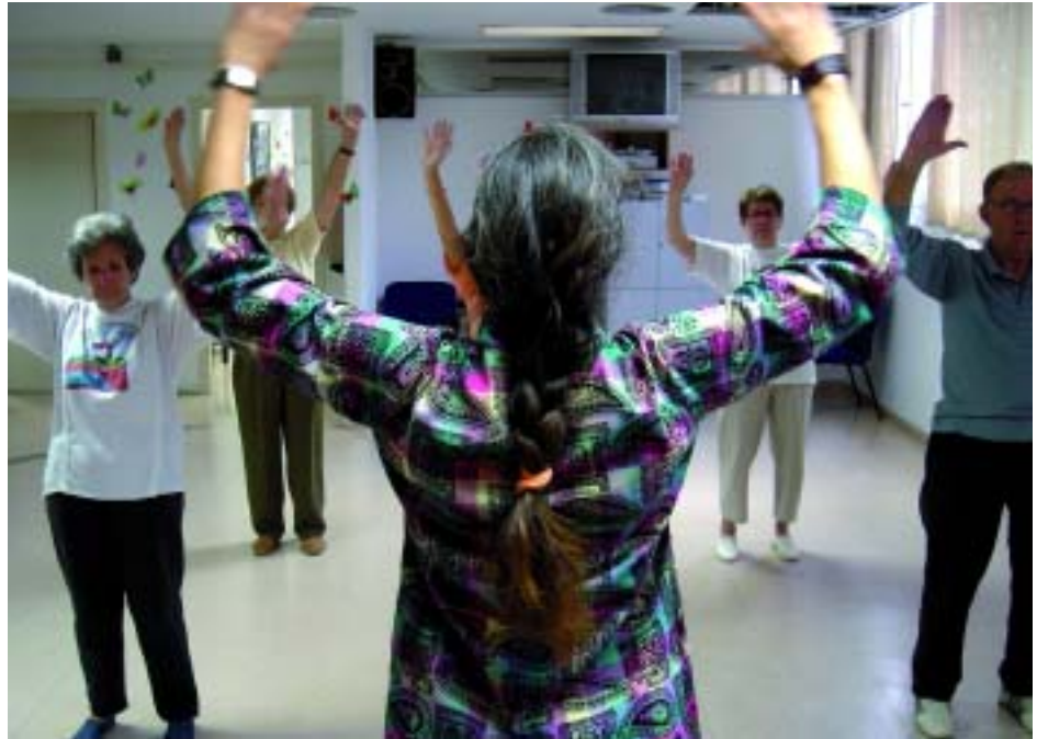
Activitat de Tai-Txi al Casal d'Avis

Segons el president dels avis “el que, per a mi, ha estat més il·lusionant de la participació al Congrés de la Gent Gran ha estat el fet de poder participar en un projecte que serà, molt probablement la base d'una llei que garantirà uns drets i uns serveis a tota la societat catalana. És molt gratificant pensar que els meus fills podran gaudir d'uns drets que entre tots hem ajudat a consolidar”.