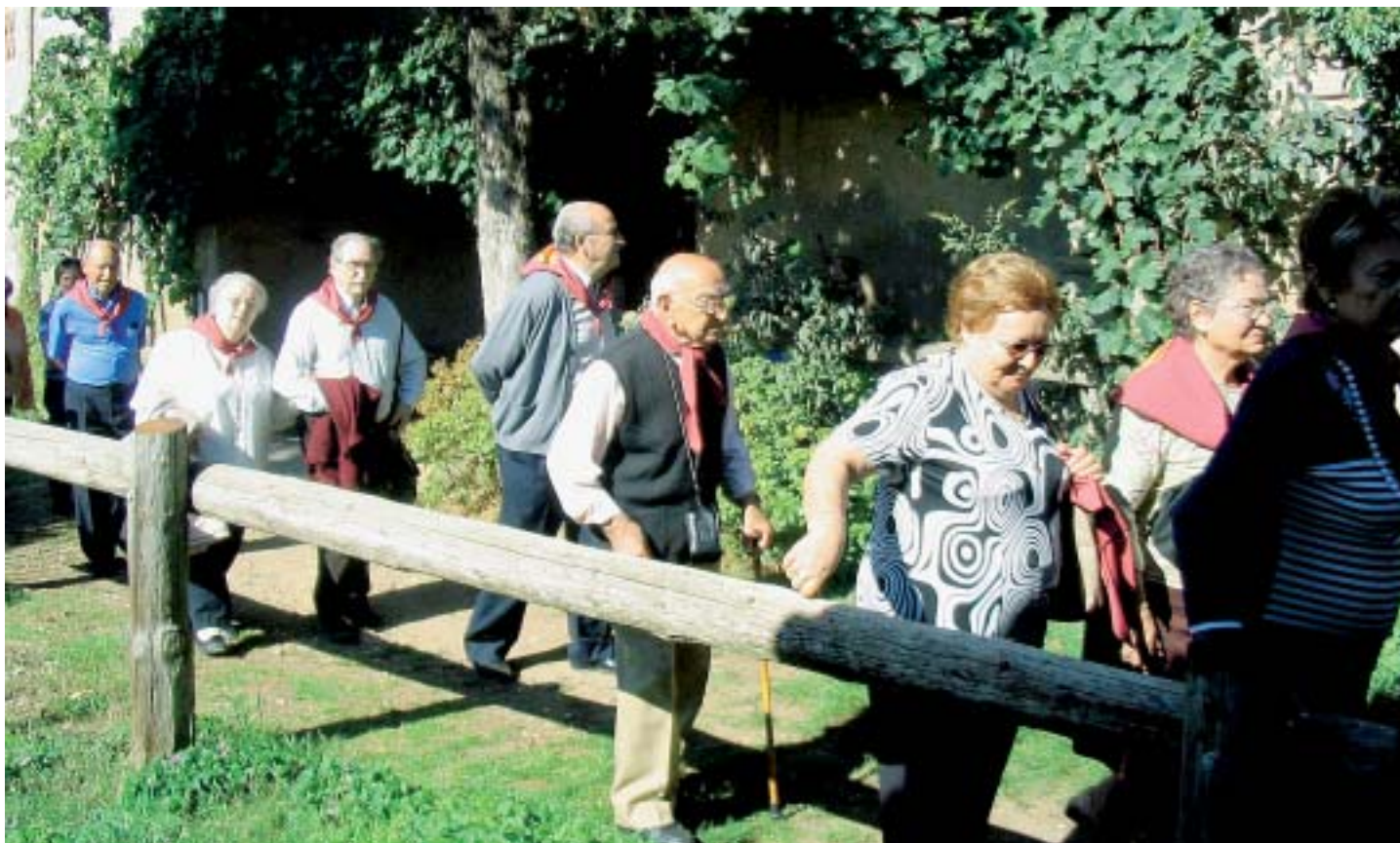
Els avis i avies al centre FUIVES del Berguedà

E ls dies 15 i 17 del passat mes de octubre els avis i avies del Papiol van fer la seva clàssica excursió anual. Aquest any la gent gran del poble va visitar el Berguedà en una sortida ben completa que va durar tot el dia, des de les nou del matí fins a les vuit de la nit.