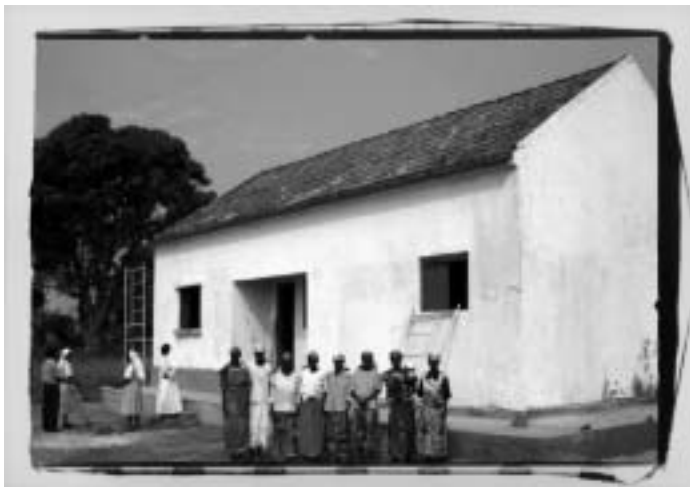
Projecte d'Àfrica subsahariana