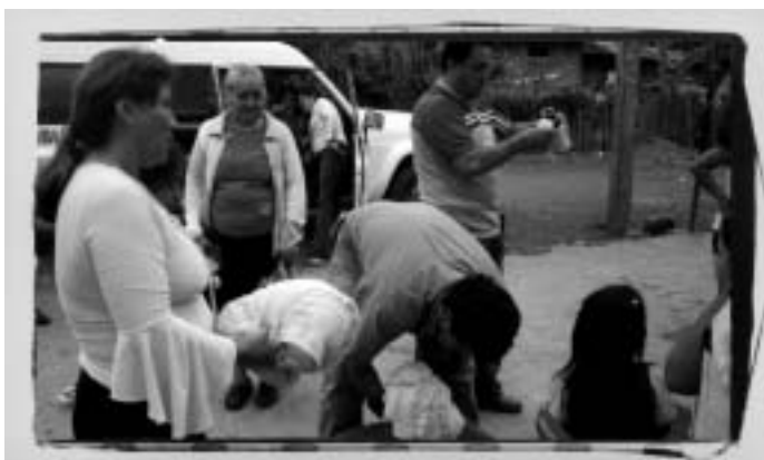
Projecte ed Sud Amèrica