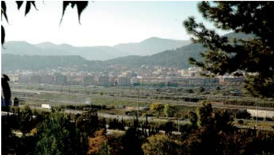
Els terrenys de conreu dels pagesos al costat del Llobregat

F inalment, després de prop de 6 mesos de lluita i reivindicació, els pagesos del Papiol, recolzats per Unió de Pagesos, l'Ajuntament i el Parc Agrari del Baix Llobregat, han aconseguit que la Generalitat rectifiqui el traçat del desdoblament del col·lector de salmorres del Llobregat.