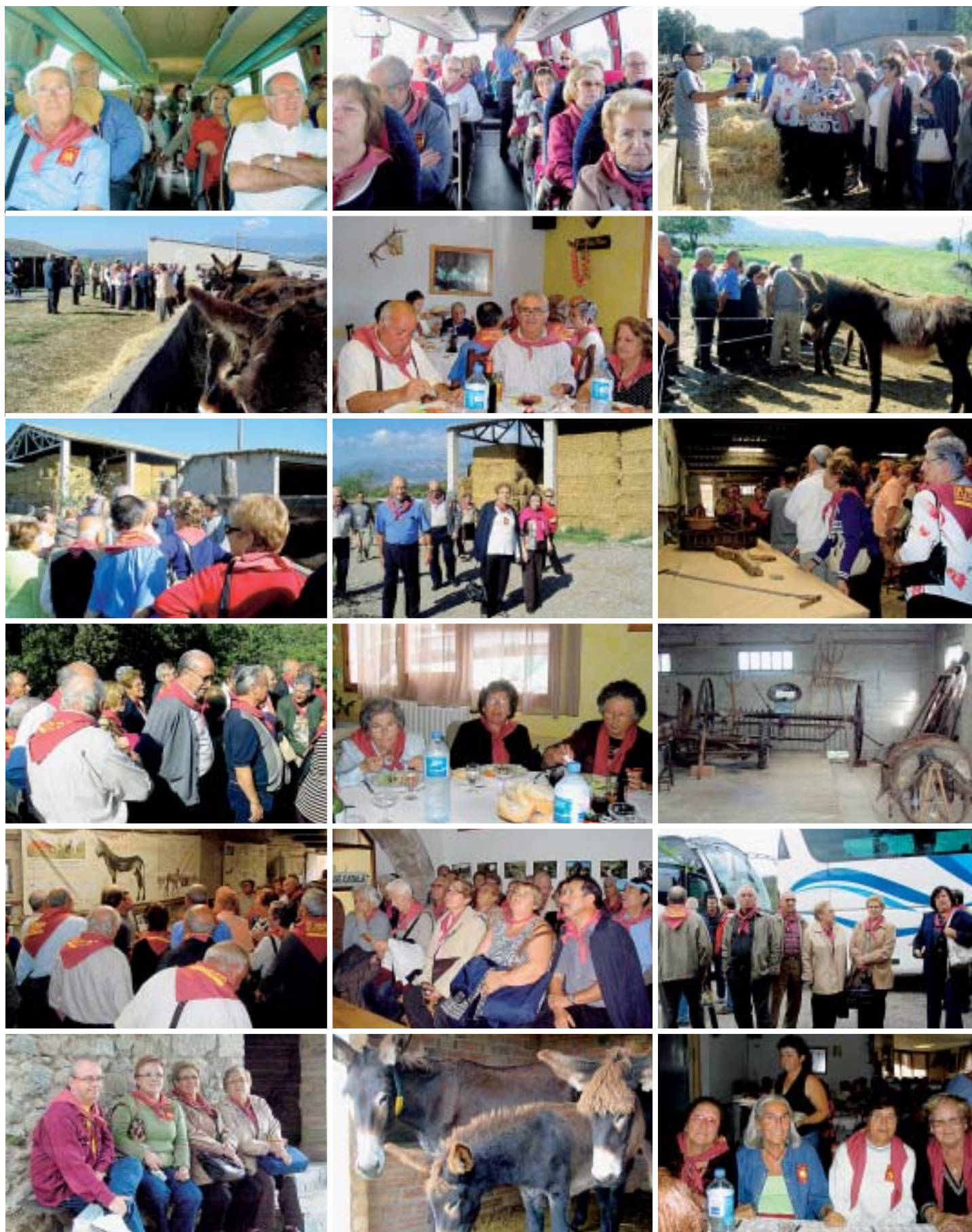
Selecció d'imatges de la sortida de la Gent Gran del Papiol