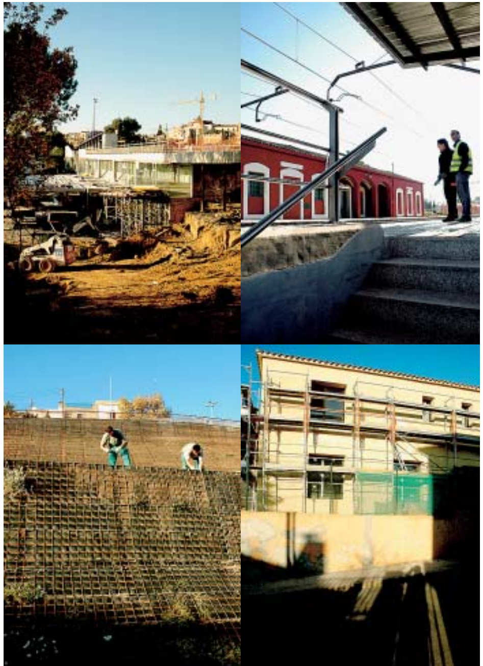
Quatre moments de les obres que estan a punt d'acabar

La construcció d'aquest pas inferior, una reivindicació de molts papiolencs i papiolenques al llarg dels últims anys, comptarà amb dues escales d'accés i dos ascensors que es posaran en funcionament en breu.