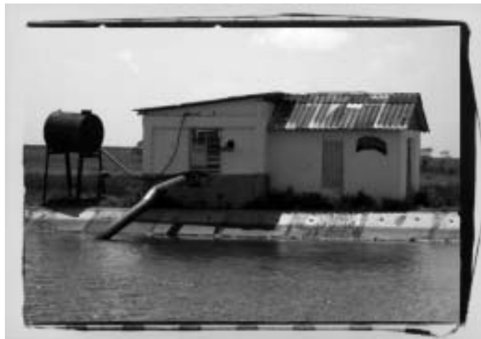
Projecte del Carib

Aquest nou mandat polític que acabem d'encetar destaca entre d'altres pel nom propi de la Cooperació. És la primera vegada que l'Ajuntament es dota d'una regidoria específica sobre el tema. Un compromís que apropa el poble a la resta del món. Segons l'alcalde Albert Vilà "necessitàvem, com han fet altres municipis abans, vincular-nos a la resta del món i hem elevat la cooperació que ja fèiem a la importància d'una regidoria per demostrar que els papiolencs i papiolenques, en tant que ciutadans globals, també volem i