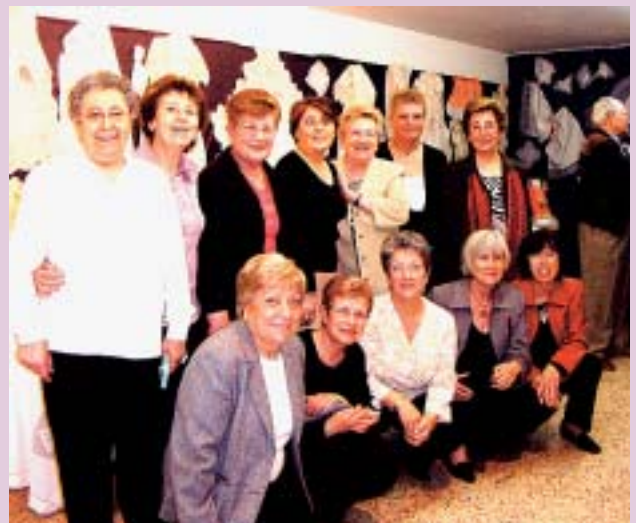
Les dones del Casal

Casal de la Dona • C/ Llibertat 12 Tel 93.673.11.95 (de dilluns a divendres de 16h a 19h)