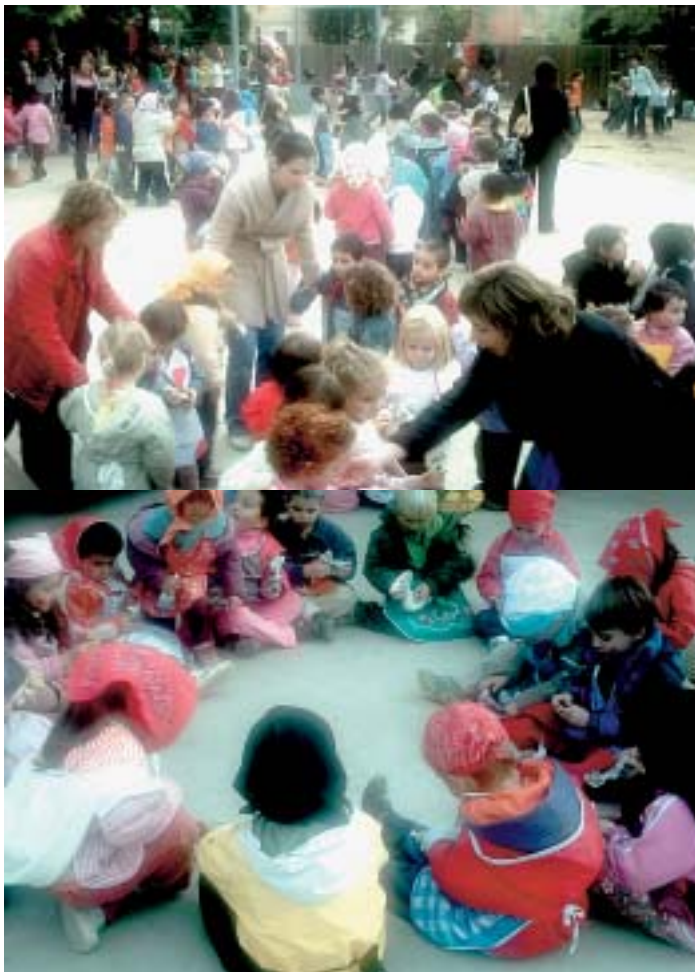
Els nens i nenes al Parc Mestre Voltes

Els nens i nenes del Papiol van celebrar la Castanyada de les escoles al Parc Mestre Voltes, un espai públic recuperat per a tots els papiolencs i papiolenques al centre del poble.