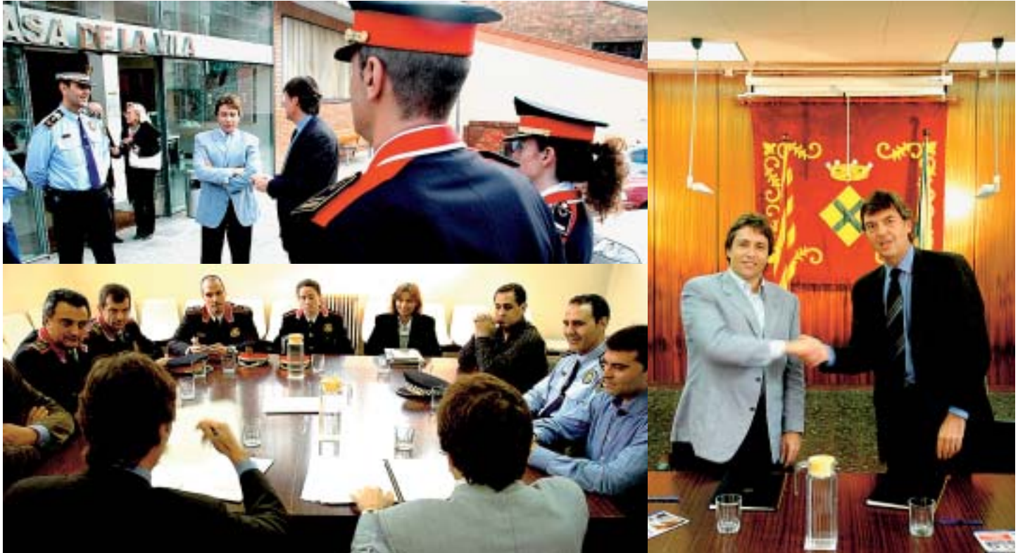
Imatges de la firma del conveni entre els representants del Departament d'Interior i l'Ajuntament

A partir d'aquest 1 de novembre els Mossos d'Esquadra assumeixen les funcions policials en l'àmbit territorial del nostre municipi. Per aquest motiu l'Ajuntament ha signat un conveni de coordinació i col·laboració en matèria de Seguretat Pública i Policia amb el Departament d'Interior, Relacions Institucionals i Participació de la Generalitat.