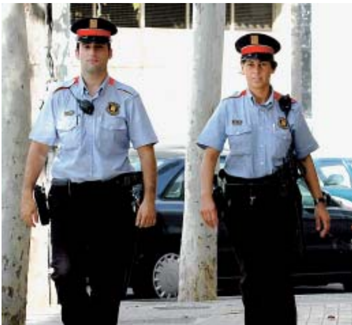
El mossos acabaran el seu desplegament per Catalunya el 2008

A partir d'aquest 1 de novembre els Mossos d'Esquadra assumeixen les funcions policials en l'àmbit territorial del nostre municipi. Per aquest motiu l'Ajuntament ha signat un conveni de coordinació i col·laboració en matèria de Seguretat Pública i Policia amb el Departament d'Interior, Relacions Institucionals i Participació de la Generalitat.