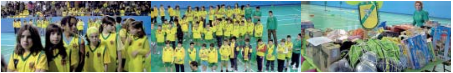
Imatges de la Festa d'inauguració de temporada de l'any passat