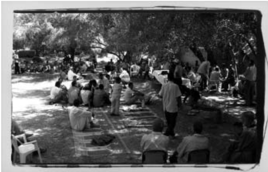
Projecte de l'Àrea Mediterrània

Si ens sentim ciutadans i ciutadanes del món, la cooperació és part de la nostra tasca. Avui en dia ja no podem tancar els ulls envers la diversitat que es mou al nostre voltant i és necessari treballar per a poder posar en equilibri una balança que només veient un telenotícies ja s'adverteix que no està compensada. Les desigualtats són cada vegada més grans i en un món amb tantes interrelacions com el que vivim actualment, el que fem aquí repercuteix allà i el que fem allà, aquí. Per aquesta raó és tant important tota la feina que es pugui fer a favor dels més desfavorits. També vull remarcar un fet molt important: Cooperar no és donar per donar. A vegades ni tan sols és donar, sinó treballar per uns objectius. Pau, justícia, drets humans, llibertat, defensa dels més desfavorits, defensa d'aquells que són discriminats... ¿Val la pena posar el nostre petit gra de sorra per millorar el món? ¿Dirigir i controlar aquest petit gra per millorar la seva qualitat, la seva eficàcia, perquè potser en puguem posar-ne dos de grans enlloc de només un? D'això va la cartera de Cooperació.