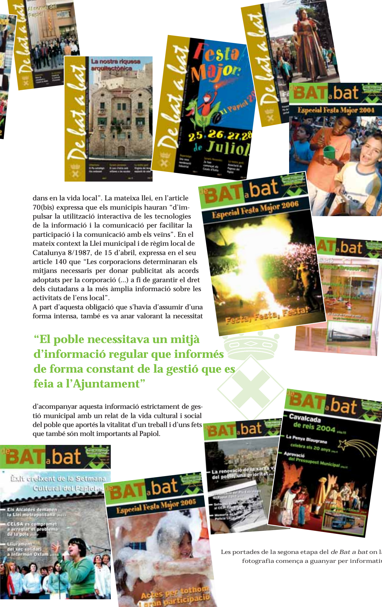
Les portades de la segona etapa del de Bat a bat on la fotografia comença a guanyar per informatiu

d'acompanyar aquesta informació estrictament de gestió municipal amb un relat de la vida cultural i social del poble que aportés la vitalitat d'un treball i d'uns fets que també són molt importants al Papiol.