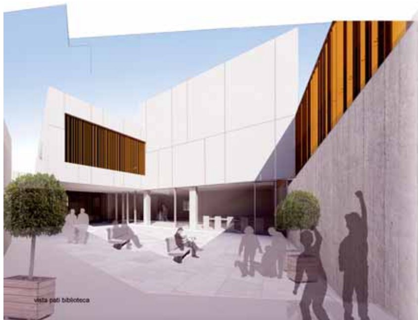
vista pati biblioteca

Imatges virtuals de com quedarà l'interior de la nova biblioteca i espai d'entitats