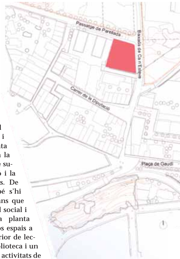
La nova Biblioteca crearà una nova centralitat dins el municipi

A la primera planta s'hi trobaran la resta dels espais propis de la biblioteca com el fons general, la música i la imatge així com el fons infantil. Alhora s'hi trobaran els espais de treball intern i direcció de l'equipament. L'aparcament del soterrani, amb accés independent, comptarà amb un espai per a 37 places.