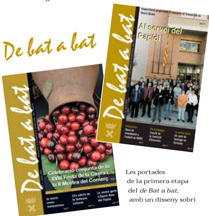
Les portades de la primera etapa del de Bat a bat , amb un disseny sobri