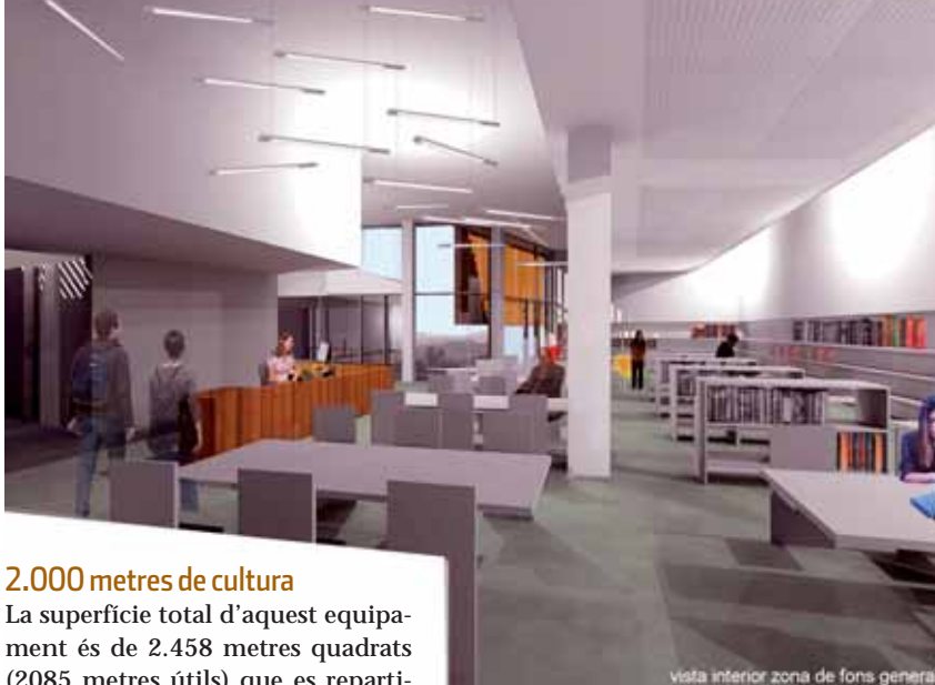
vista interior zona de fons general