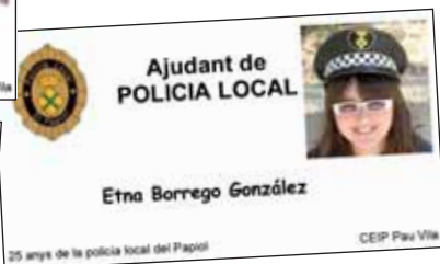
Els guanyadors del premi de pintura amb el seu carnet d'ajudants de Policia Local