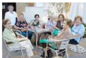
Els avis i àvies al poble de Canet

Tenim molts anys i ens ha tocat viure diverses èpoques de crisi. Constatem que la majoria d'aquestes crisis han estat produïdes per l'afany de lucre d'uns pocs i els efectes sempre els pateixen amb més intensitat els col·lectius més desfavorits i vulnerables. La principal conseqüència de la crisi és l'augment de la pobresa, d'una pobresa que encara queda oculta i que hauria de ser tema prioritari a l'agenda política. Cada cop són més he-