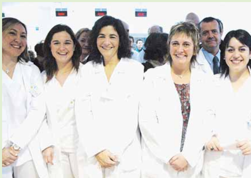
Personal assistent a la inauguració