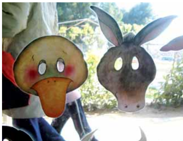
Els nens i nenes del poble poden començar l'escola al Cucut

disposa de quatre aules i d'un espai d'usos múltiples. Cada dues aules comparteixen un canviador amb visibilitat sobre l'aula, WC de diferents mides i piques d'aigua a l'abast dels infants. La cuina, el bany d'adults i un despatx completen les instal·lacions. L'escola té un total de 7 educadores i 2 auxiliars. 5 mestres són tutores de grup i les altres 2 són de suport. Dedicuen 6 hores i mitja a l'educació dels infants i mitja més diària, no lectiva, per a les reunions d'organització, preparació i formació.