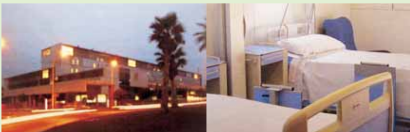
L'hospital, un centre de qualitat

Cardiologia, Dermatologia, Digestiu, Endocrinologia i nutrició, Medicina interna (reumatologia), Oncohematologia, compartit amb l'Institut Català d'Oncologia (ICO), Nefrologia, Neurologia, Respiratori, Unitat de vigilància intensiva (UVI), Cirurgia general, Cirurgia ortopèdica i traumatologia, Cirurgia vascular, coordinat amb l'Hospital Universitari de Bellvitge (HUB), Oftalmologia, Otorinolaringologia, Urologia, Anatomia patològica, Anestèsia i reanimació, Farmàcia, Laboratori, Radiodiagnòstic, Rehabilitació, Unitat interdisciplinària sociosanitària de geriatría (UFISS), Treball social.