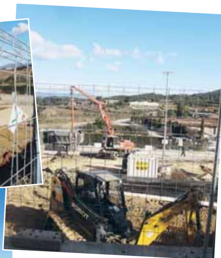
Imatges dels primers dies d'obres per a la construcció de la Biblioteca

A finals d'aquest passat mes de gener s'ha donat el tret de sortida a l'inici de les obres per a la construcció de la Biblioteca, Espai per a entitats i Aparcament al poble, un equipament cultural que dotarà el Papiol d'un nou centre poliva-