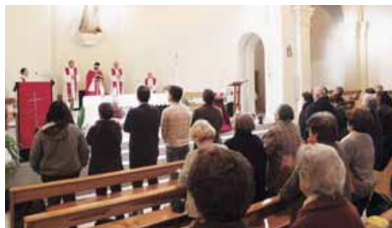
La missa de Festa Major

Dins el programa d'aquest any s'hi ha incorporat el lliurament de diplomes als Voluntaris per la llengua del Servei Local de Català del Consorci per a la Nor-