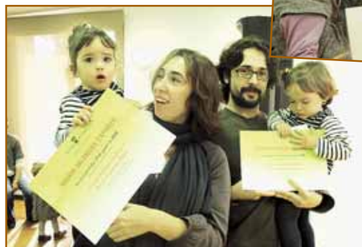
Imatges dels nens i nenes per als quals es va fer l'acte de benvinguda