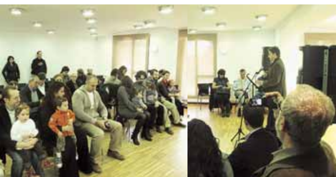
L'auditori s'omple per a fer les benvingudes

El passat 21 de novembre va tenir lloc a l'Auditori de l'Escola Municipal de Música Miquel Pongiluppi la 2a Benvinguda als papiolencs que es fa al poble, un acte pel qual el mateix poble vol fer públic un reconeixement d'acolliment als nens i nenes que han nascut al Papiol, alhora que es compromet conjuntament amb la seva família a vetllar per la seva educació i defensar i garantir els seus drets.