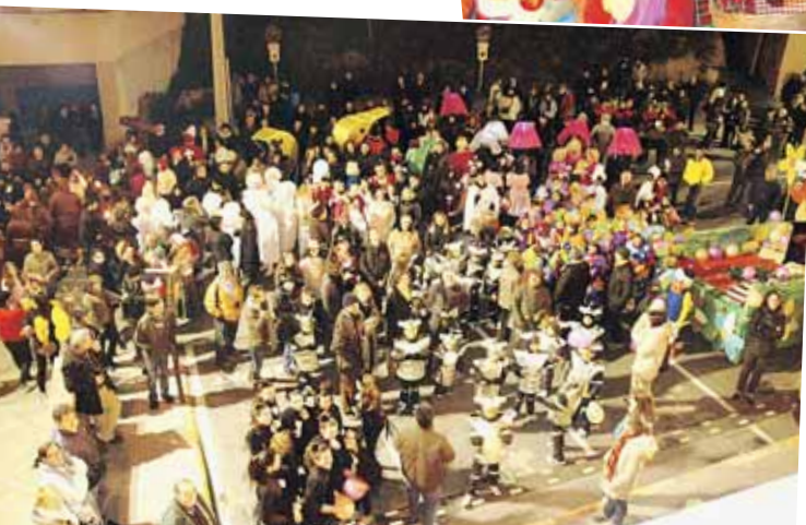
Disfresses i més disfresses omplen els carrers del Papiol