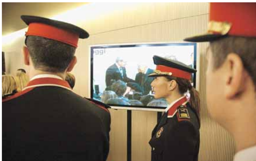
Els Mossos d'Esquadra també van assistir a l'acte

Un dels punts clau ha estat potenciar l'estalvi i l'eficiència energètica: es tracta de reduir l'impacte derivat del consum d'energia, al llarg de la vida útil de l'edifici, així com de disminuir l'emissió de CO 2 i de substàncies tòxiques (NOx, SOx) a l'atmosfera.