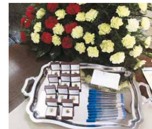
Insígnies rebudes pels regidors i paperets per fer la votació per escollir l'alcalde