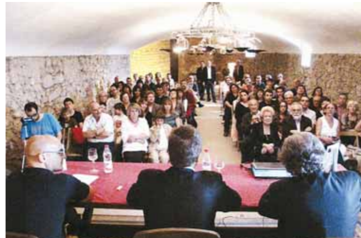
La Sala del Castell es va omplir de participants a l'acte