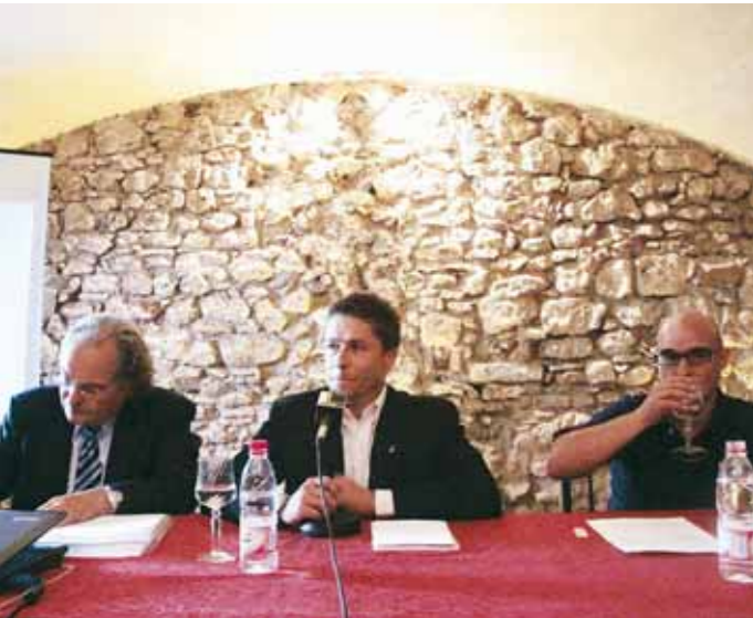
Taula amb l'alcalde, l'autor del llibre i el director de l'Arxiu Nacional de Catalunya