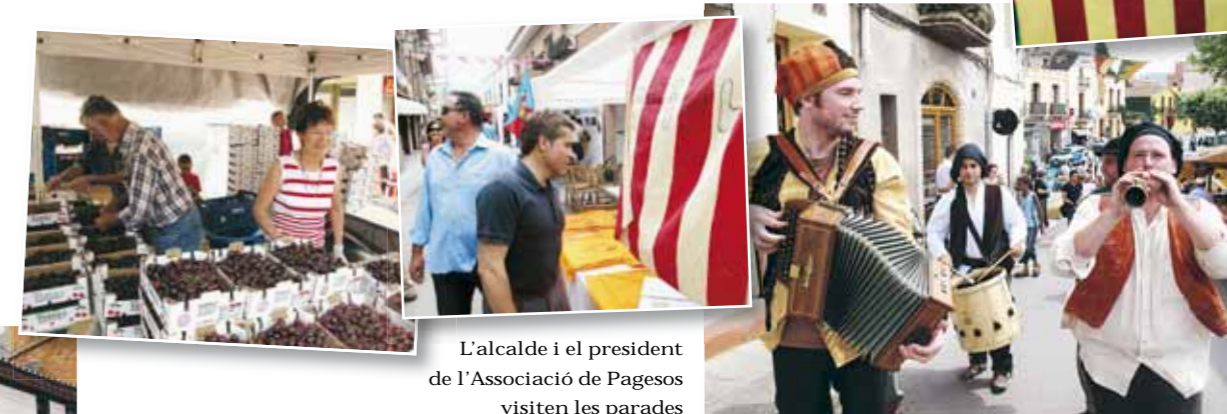
L'alcalde i el president de l'Associació de Pagesos visiten les parades

El passat cap de setmana del 4 i 5 de juny va tenir lloc al nostre poble la XXIX edició de la Festa de la Cirera, una de les celebracions més emblemàtiques del nostre calendari festiu i una oportunitat per gaudir del Papiol i de la històrica aportació dels nostres pagesos a la vida social i cultural de la vila. Centenars de papiolencs van gaudir de dos dies d'animació, cultura i gastronomia al nucli antic del Papiol.