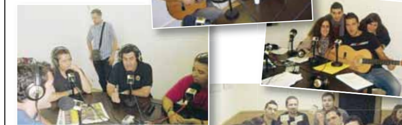
Col·laboradors de la ràdio municipal Papiol FM

En segon lloc, els nous espais musicals "My Space" i "Ja és dijous" han ampliat, amb una bona acollida de l'audiència, el ventall musical de la