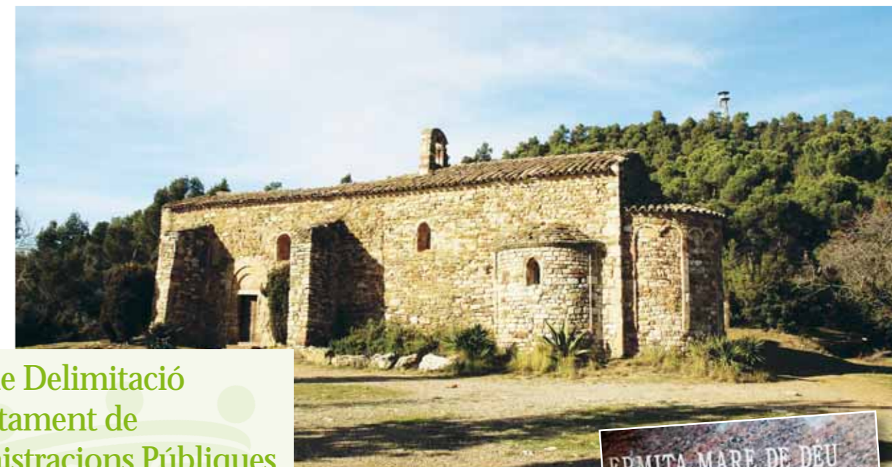
Ermita de la Salut del Papiol i detall de la inscripció