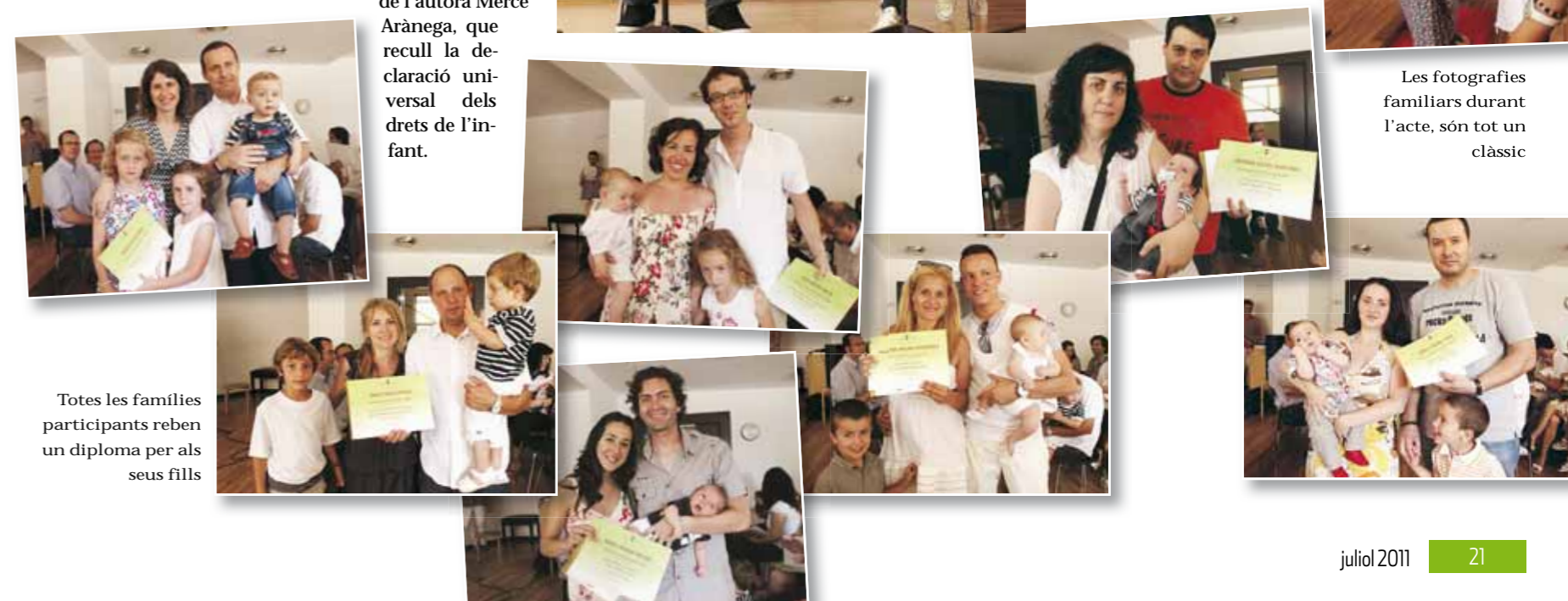
Totes les famílies participants reben un diploma per als seus fills