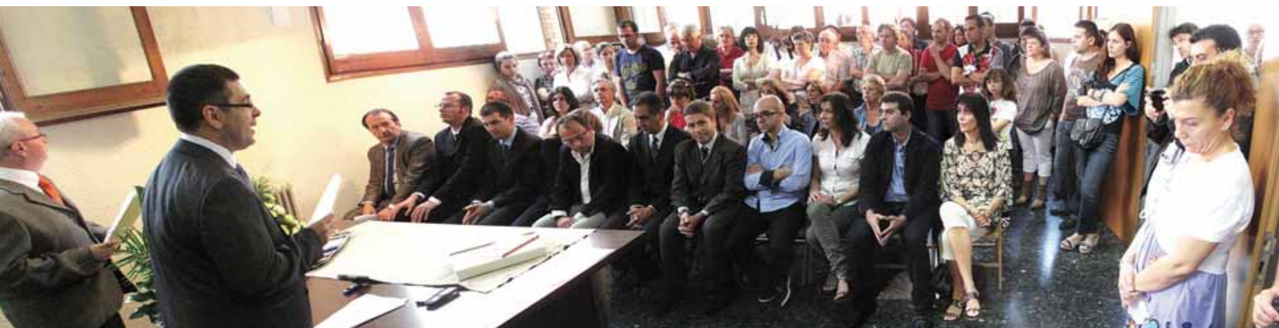
Imatge de la Sala de Plens, amb els regidors i regidores i un nombrós públic assistent