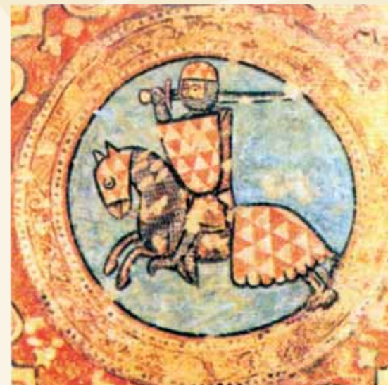
Representació d'un cavaller català del segle XIII