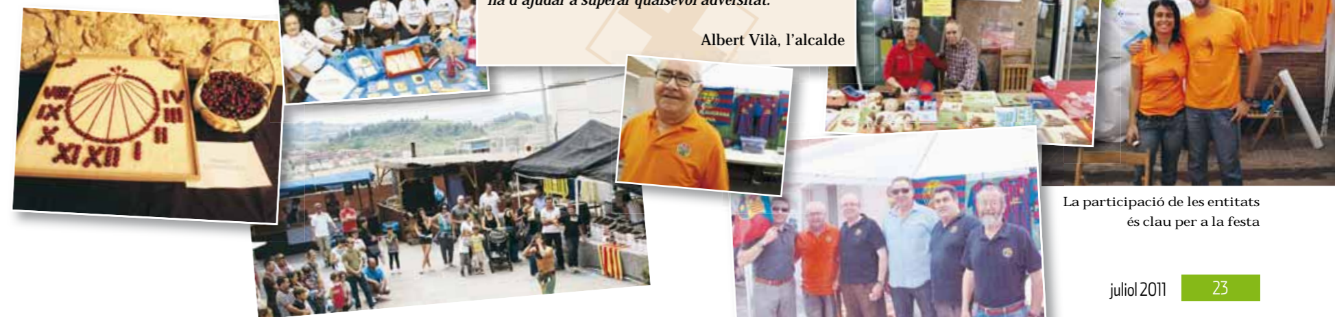
La participació de les entitats és clau per a la festa