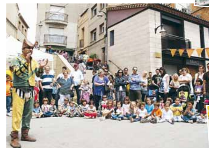
La plaça de l'Església, plena de gom a gom

"La col·laboració de moltes entitats i associacions és bàsica per a l'èxit de la festa"