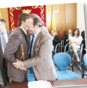
DEL PAPIOL, AMB LLEIALTAT AL REI, OBSERVANÇA DE LA CONSTITUCIÓ I DE L'ESTATUT D'AUTONOMIA DE CATALUNYA?"

"JUREU O PROMETEU PER LA VOSTRA CONSCIÈNCIA I HONOR COMPLIR FIDELMENT LES OBLIGACIONS DEL CÀRREC DE REGIDOR/A DE L'AJUNTAMENT