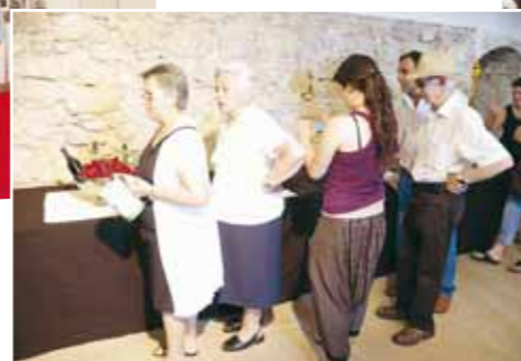
Imatges de l'exposició de cireres al castell