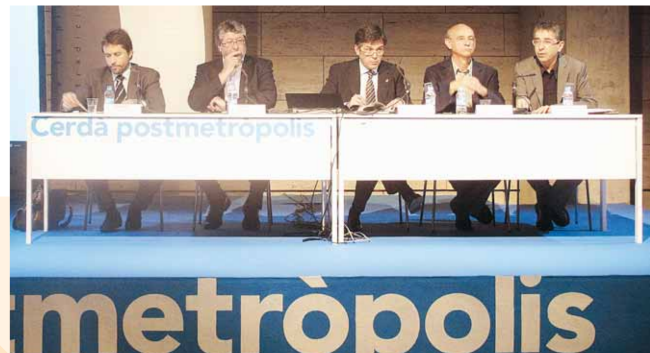
L'alcalde del Papiol al costat de l'alcalde de Cornellà, l'alcalde de Sant Cugat, l'alcalde de Tiana i el Delegat de Cultura de Barcelona

del centre de Barcelona al centre del nostre poble en transport públic, necessitaves més d'una hora, ara hem pogut reduir el temps a la meitat... De fet, si tots els municipis millorem el nostre territori, l'Àrea guanya. Si l'Àrea guanya, la fem més competitiva internacionalment. El Citilab de Cornellà, un nou poliesportiu a Tiana, el Campus d'Esade a Sant Cugat, un millor aeroport al Prat, l'arribada de l'AVE a Barcelona... Cadascú ha de treballar en la mesura de les seves possibilitats, però en una mateixa direcció, amb un mateix interès: el benestar dels nostres ciutadans. Entre tots sumem una nova realitat urbana, una realitat que s'ha d'institucionalitzar... i aquesta voluntat política d'esdevenir tots junts aquesta entitat administrativa de caràcter plurimunicipal és la que ens permetrà resoldre diferents problemes que tenim, tots, de forma mancomunada: • Ens permetrà adquirir una massa crítica de població econòmica i de serveis, • ens permetrà planificar el territori perquè esdevingui sostenible, cohesionat i competitiu, • ens permetrà seguir treballant per fer de l'àrea un dels motors d'Europa i de la Mediterrània. Per l'àrea, els anys en què per un costat els socialistes i per l'altre els convergents van