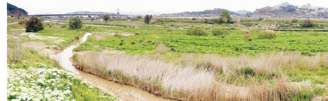
El riu Llobregat al seu pas pel Papiol

Des de la passada tardor s'està duent a terme un projecte de restauració del riu Llobregat, concretament al tram comprès entre les poblacions de l'àrea metropolitana de Barcelona del Papiol, Pallejà i Sant Andreu de la Barca. És el tram aigües avall de la confluència del riu Llobregat amb la riera de Rubí. Aquest projecte té com a objectiu la millora ambiental del riu des del punt de vista ecològic com a sistema natural: se'n vol potenciar i millorar la funció de connector ecològic, amb la finalitat de recuperar al màxim els seus valors naturals i la seva biodiversitat. Els aspectes més importants es resumeixen en els següents trets: