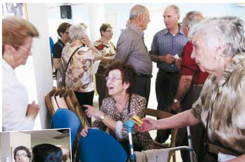
Imatges del Casal d'Avis el dia de la presentació del Centre de Serveis per a la Gent Gran

afavorit encara més la xarxa de serveis a les persones del nostre Ajuntament. Els Serveis Socials Bàsics són el primer esglaó i punt d'accés de la població als serveis socials. Amb tot l'equip de Serveis Socials Bàsics i també amb el suport d'un tècnic del Consell Comarcal (que ofereix 150 hores anuals d'un