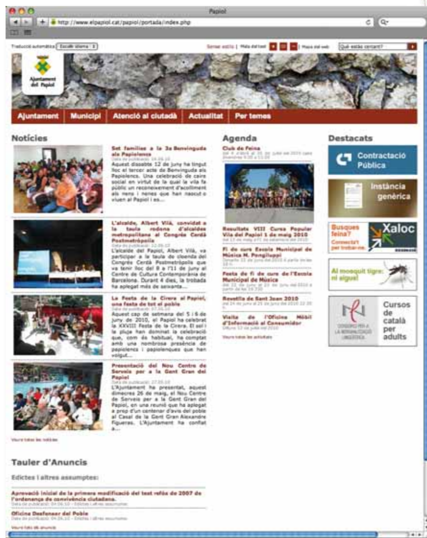
Imatges de diferents pantalles de la nova web de l'Ajuntament