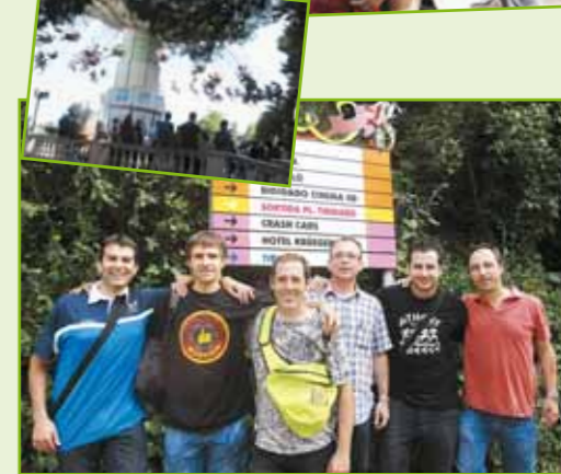
Membres de l'Esport Base al Tibidabo, atracció del parc i la junta de l'Entitat