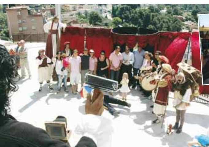
Inauguració tradicional de la Festa de la Cirera

El passat cap de setmana del 5 i 6 de juny de 2010, el Papiol va celebrar la XXVIII Festa de la Cirera. El sol i la pluja van dominar la celebració que, com és habitual, va comptar amb una nombrosa presència de papiolencs i papiolenques que van voler participar d'aquesta festa tan tradicional.