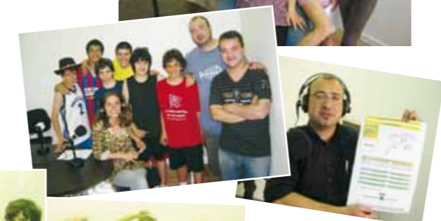
Els col·laboradors de Papiol FM, donen vida a la ràdio del poble

nosaltres per mitjà de diferents col·laboracions que han estat realment enriquidores. També volíem començar a crear una dinàmica d'espais de llarga durada que ens oferissin la possibilitat d'obrir els nostres micròfons durant gairebé 60 minuts setmanals a diferents veus i entitats; la continuació del que l'any passat vam endegar amb l'espai Fórmula Papiol (un programa on cada dimarts i dijous una persona diferent ens parla de la música que més li agrada). Així, l'espai d'entrevistes Papioleix ha estat una plataforma des d'on hem pogut conèixer una mica més alguns dels nostres veïns i veïnes, que molt gustosament s'han ofert a contestar totes aquelles preguntes que els hem fet. I encara més: aquestes darreres setmanes hem incorporat a la nostra graella dos nous espais. D'una banda, trimestralment, tothom tindrà l'oportunitat de preguntar allò que vulgui al batlle de la vila al programa L'alcalde respon . De l'altra, cada cap de setmana l'espai Celler electrònic obre les seves portes per apropar-nos la millor música de ball. En aquest sentit, cal remarcar que el proper mes de juliol encara hi haurà noves incorporacions a la nostra graella, de les quals us informarem puntualment a la nova web de l'Ajuntament del Papiol www.elpapiol.cat i a través del nostre perfil a Facebook.