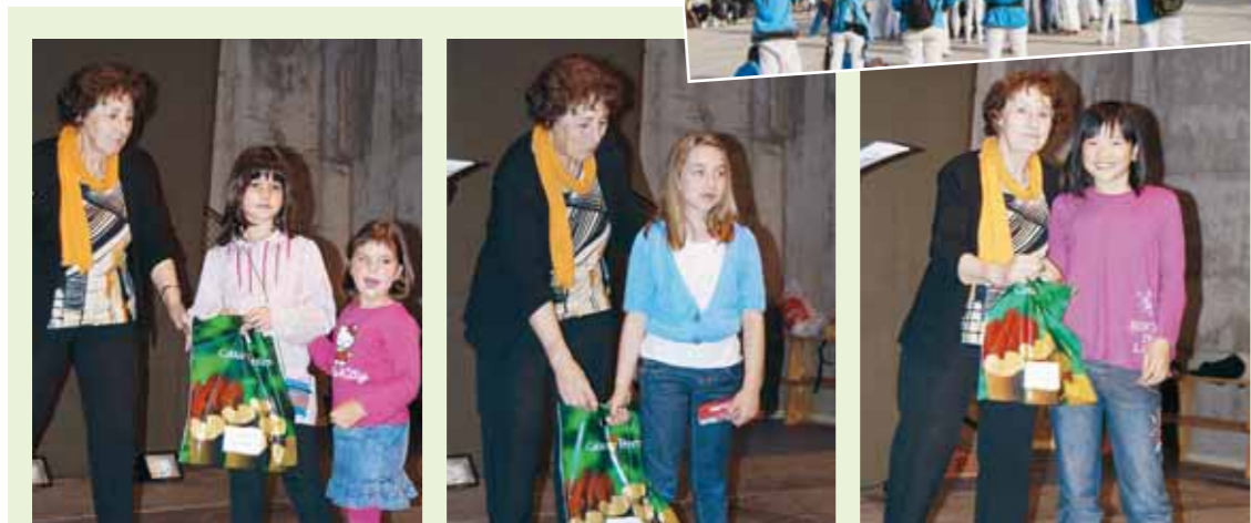
Premis, exposicions, xerrades... van omplir de Cultura El Papiol

Entre els dies 23 d'abril i el 2 de maig va tenir lloc al nostre poble la Setmana Cultural del Papiol, un conjunt de prop de cinquanta propostes per a tots els públics que van fer viure la força de la cultura a tots els papiolencs. 10 dies amb concerts, exposicions, lectures públiques, tallers, dinars populars o xerrades que van fer del nostre poble un espai actiu culturalment on la participació ciutadana va ser cabdal per l'èxit de totes les activitats.