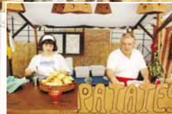
El mercat tradicional va acompanyar els dies de festa