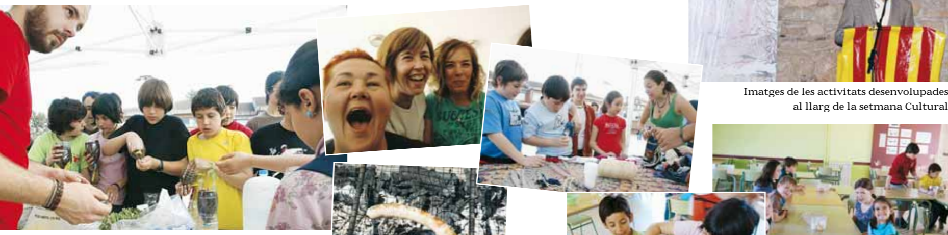
Imatges de les activitats desenvolupades al llarg de la setmana Cultural

Entre els dies 23 d'abril i el 2 de maig va tenir lloc al nostre poble la Setmana Cultural del Papiol, un conjunt de prop de cinquanta propostes per a tots els públics que van fer viure la força de la cultura a tots els papiolencs. 10 dies amb concerts, exposicions, lectures públiques, tallers, dinars populars o xerrades que van fer del nostre poble un espai actiu culturalment on la participació ciutadana va ser cabdal per l'èxit de totes les activitats.