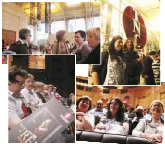
Imatges de la sortida al Teatre Nacional