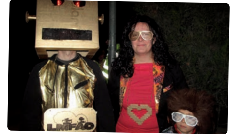
Diversos moments de la gran festa del Carnestoltes.