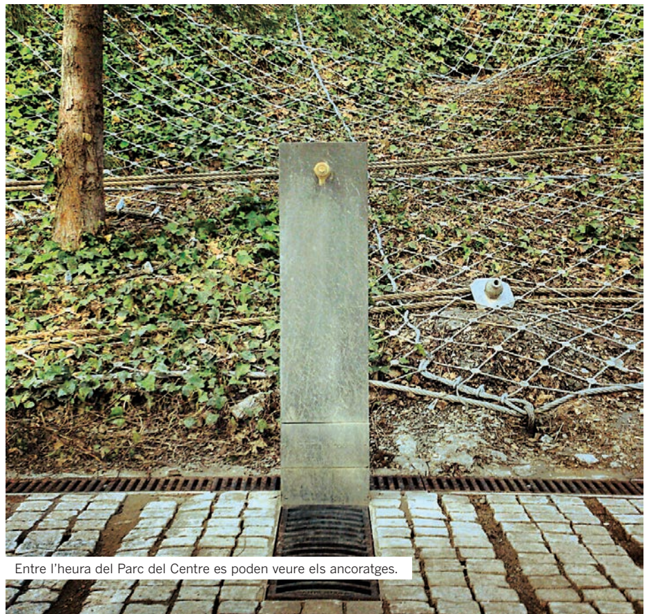
Entre l'heura del Parc del Centre es poden veure els ancoratges.

Les obres d'estabilització també han afectat el Parc del Centre, que s'ha hagut de tancar al públic durant l'execució del projecte. Com que el manteniment del parc va a càrrec de l'Àrea Metropolitana de Barcelona, aquesta ha decidit aprofitar el tancament per fer-hi millores tècniques relacionades amb el sistema de reg i el sistema de drenatge. ●