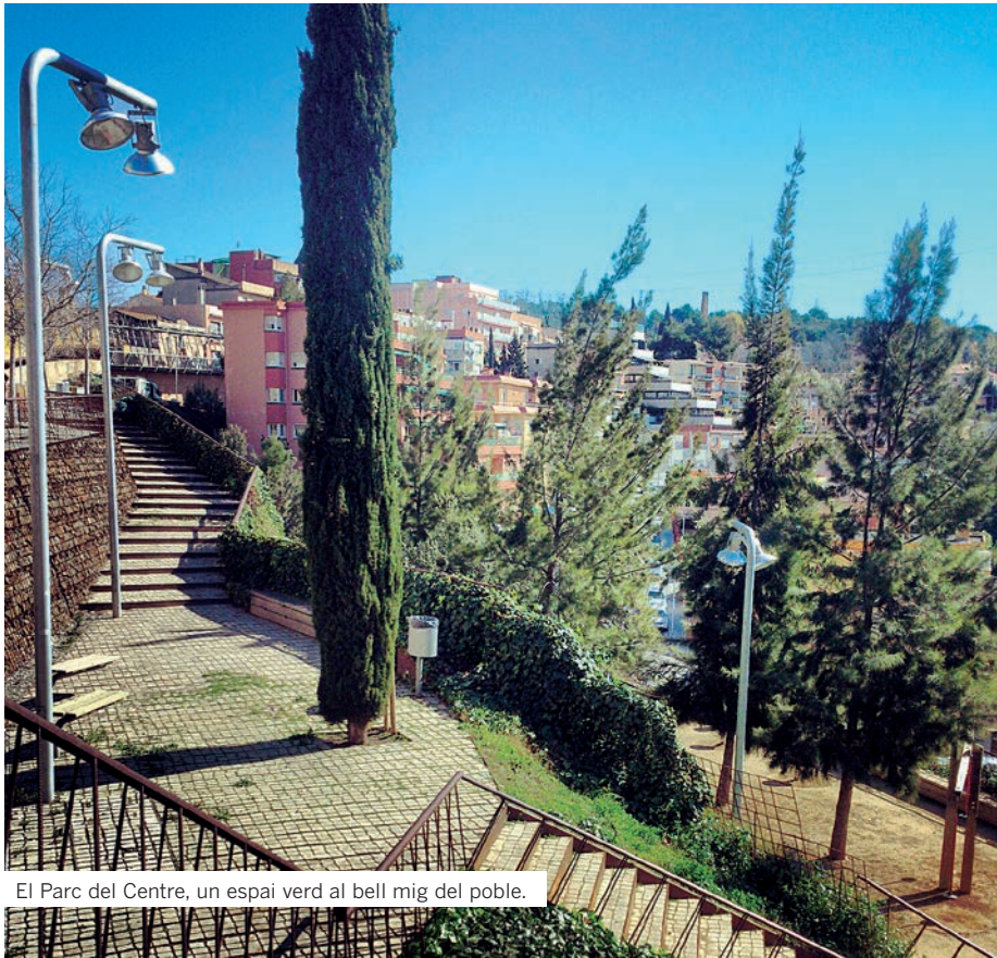
El Parc del Centre, un espai verd al bell mig del poble.