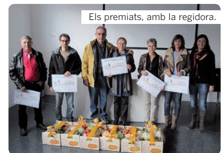
Els premiats, amb la regidora.