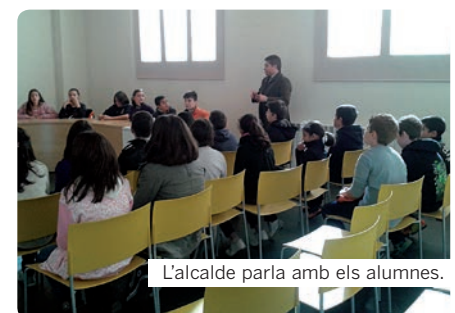
L'alcalde parla amb els alumnes.

que hi treballen. Els nois i noies de l'Escola Pau Vila també van tenir l'oportunitat de preguntar a l'equip de govern diverses qüestions del seu interès. Entre d'altres, els alumnes van preguntar si seria possible il·luminar millor la zona esportiva o van demanar un cartell de 'Benvinguts al Papiol' a l'entrada del poble. ●