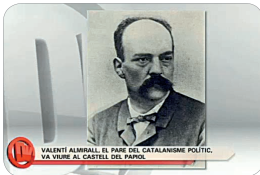
VALENTÍ ALMIRALL, EL PARE DEL CATALANISME POLÍTIC, VA VIURE AL CASTELL DEL PAPIOL