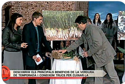
DESCOBRIM ELS PRINCIPALS BENEFICIS DE LA VERDURA DE TEMPORADA I CONEIXEM TRUCS PER CUINAR-LA