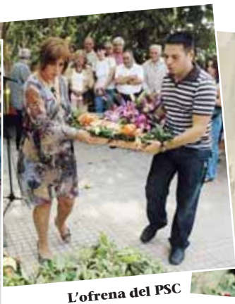
L'ofrena del PSC