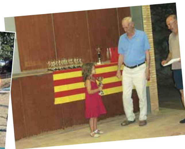
Els partits de tennis, així com els enfrontaments al pavelló entre solters i casats van animar les competicions esportives.

El tir amb arc va ser una de les proves estrella pels més petits així com la gimcana infantil.