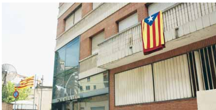
L'estelada, al balcó de l'Ajuntament