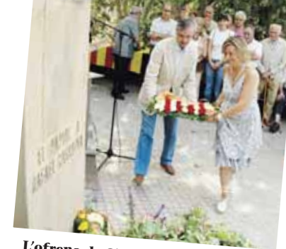
L'ofrena de CiU

El dia 11 de Setembre a la una del migdia es van reunir davant del monument a Rafael Casanova del Papiol prop de 150 persones que volien celebrar públicament la Diada Nacional de Catalunya. Com ja és habitual els grups polítics del poble, tant els que tenen representació al consistori com els que no, van fer la ofrena floral al monument. Junts pel Papiol, Esquerra Republicana de Catalunya, Convergència i Unió, el Partit dels Socialistes de Catalunya, Iniciativa per Catalunya i el Partit Popular van ser-hi presents.