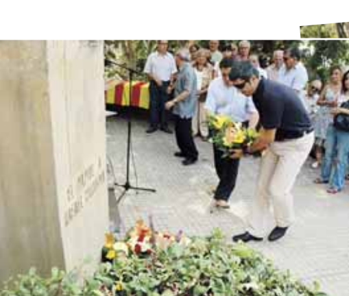
L'ofrena de Junts