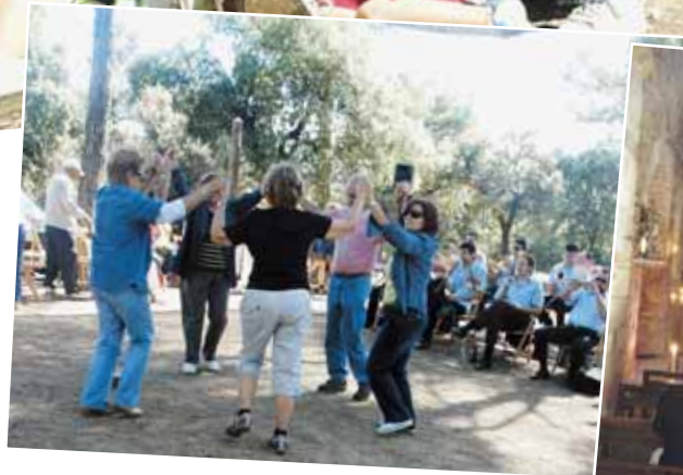
L'espai natural on es va aixecar l'Ermita de la Salut congrega centenars de papiolencs amb ganes de passar-ho bé.