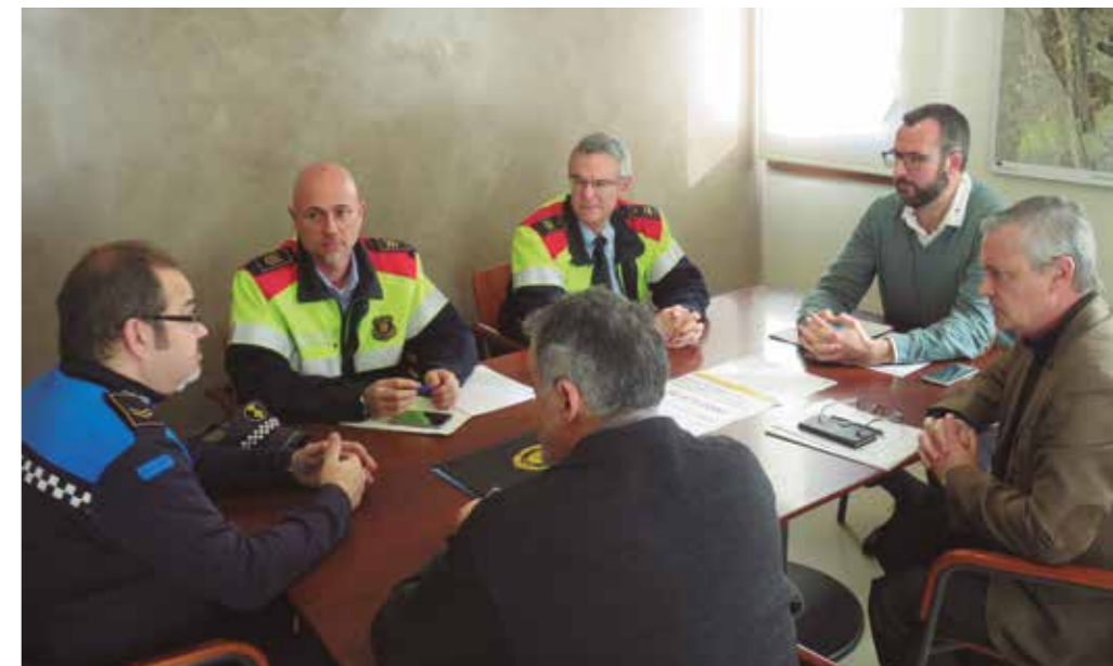
Govern local, Policia Local i Mossos es reuneixen periòdicament per parlar de seguretat.

La Xarxa Xaloc, impulsada per les diferents diputacions provincials, dona suport als serveis locals d'ocupació que l'integren, com el Servei d'Ocupació del Papiol, que ha estat felicitat per Xaloc pels resultats aconseguits des de l'abril de 2017, pel que fa al nombre de vacants de feina que s'han cobert des de la Borsa de Treball del Papiol.