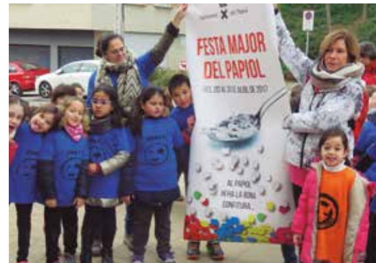
La Festa Major va atreure l'interès de l'alumnat.

"Als alumnes, els ha motivat molt perquè han estudiat una cosa que és seva".