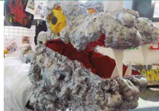
Reproducció del Cavall Armat, dels nens i nenes del Pau Vila.