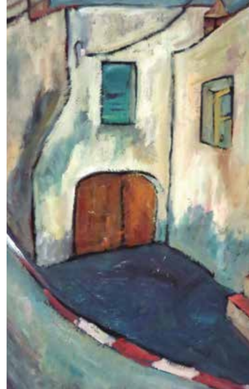
Quadre pintat durant un Concurs de Pintura Ràpida.