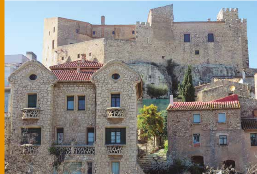
Alguns dels tresors arquitectònics del Papiol.