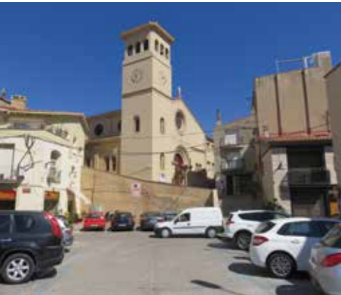
Abans de les obres

El curs 2017-2018 ha estat un període urbanísticament important al Papiol. S'ha reurbanitzat el nucli antic del poble per dignificar-lo i fer-lo més disponible i funcional i, d'altra banda, s'està treballant en la principal via del municipi perquè sigui una avinguda més que una carretera.