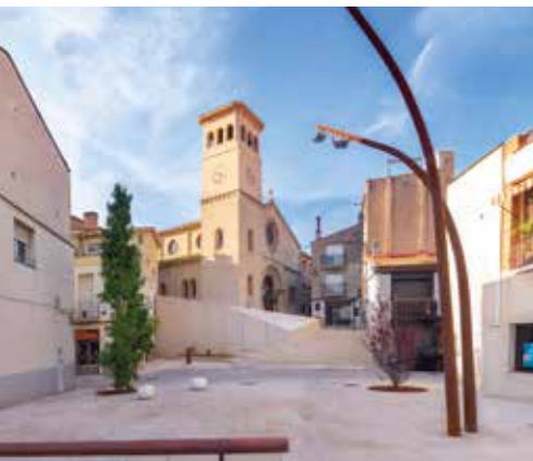
Després de les obres