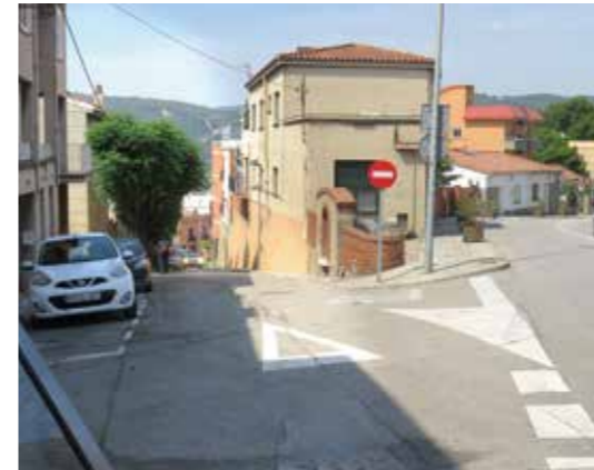
Abans de les obres