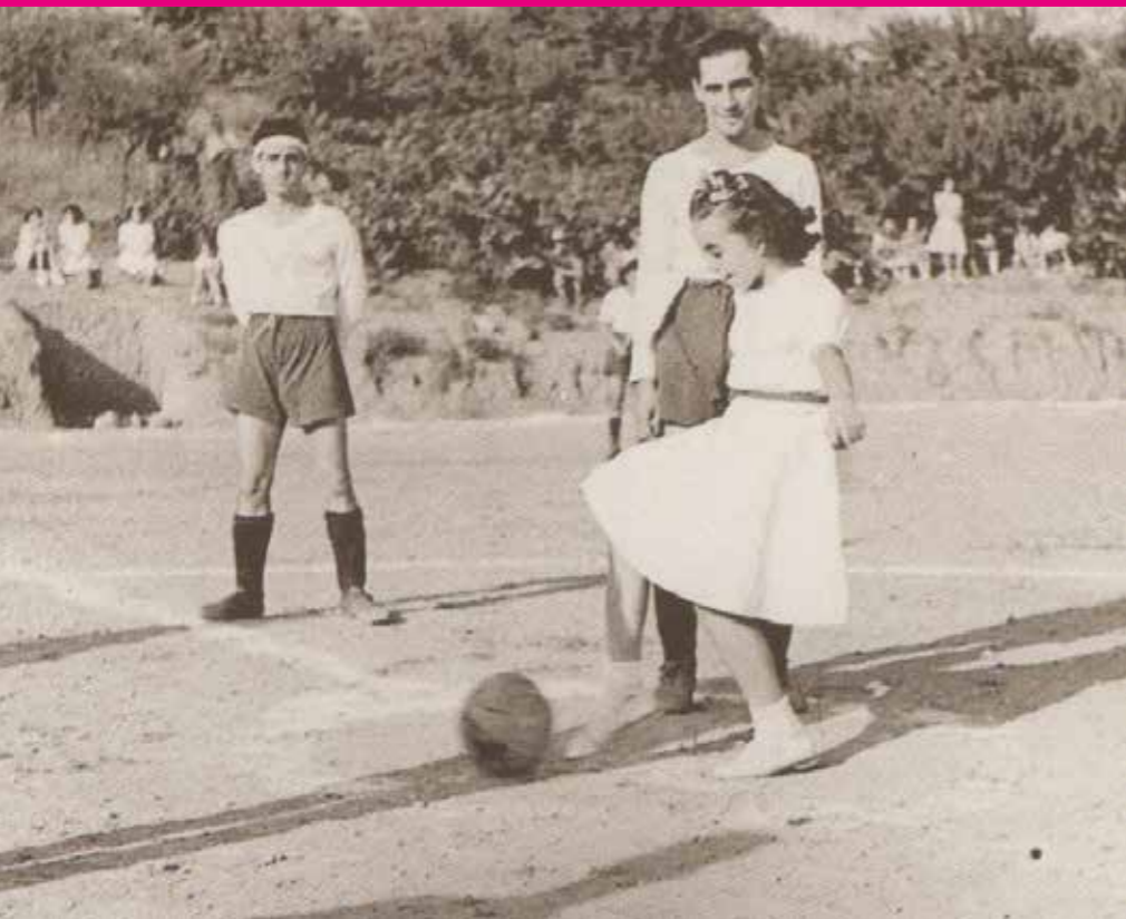
Pubilla fent un servei d'honor.

Hi ha moltes maneres de narrar com canvia un poble; per exemple, a través de les diferents activitats esportives que s'hi han practicat a cada moment. A partir de la feina del Museu del Papiol per a la seva darrera exposició, resumim cronològicament com han influït les instal·lacions i el context en l'hegemonia d'uns esports o d'uns altres.