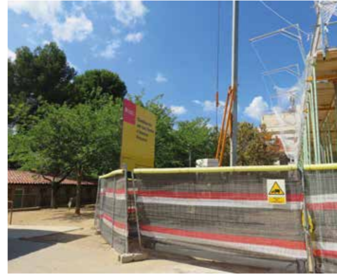
Plaça del nou ambulatori

Tota aquesta zona del nucli urbà (carrer Major, plaça de l'Església, carrer de l'Abat Escarré, carrer de Barcelona i plaça de Rafael Casanova) quedarà més unificada: esdevindrà tota una plataforma única, ja que se suprimiran les voreres i l'espai destinat als cotxes quedarà al mateix nivell.