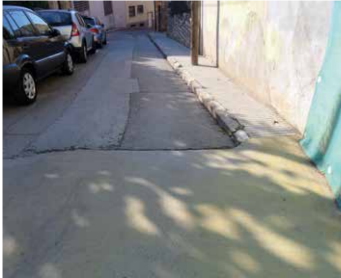
Carrer de l'Abat Escarré

L'Ajuntament remodelarà durant el 2022 i el 2023 el carrer de l'Abat Escarré, el carrer de Barcelona i la plaça de Rafael Casanova. Les obres són la continuació de la remodelació del carrer Major i de la plaça de l'Església. S'arranjarà la plaça del nou ambulatori i el carrer del Papiol de Baix.