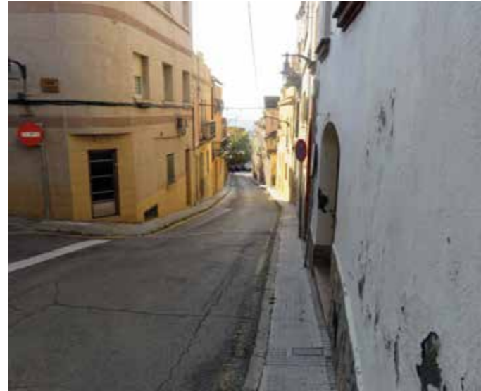
Carrer de Barcelona

La intervenció al carrer de l'Abat Escarré farà que el centre del poble quedi urbanísticament més harmonitzat i resulti més accessible als vianants. L'Ajuntament ha explicat al Consell del Poble i al veïnat com serà la remodelació i ha tingut en compte les seves propostes i suggeriments.