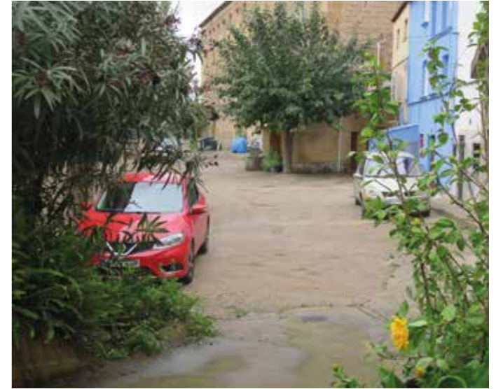
Carrer de Papiol de Baix

Molt aviat, la zona on s'està aixecant el nou centre d'atenció primària serà un punt neuràlgic al Papiol, un cop inaugurat l'ambulatori. Això mereix l'arranjament de la plaça al voltant de la qual s'estructura l'anomenada "illa sociosanitària", on hi ha el Centre de Dia i el Casal dels Avis.