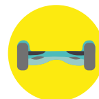
Plataforma de dues rodes