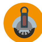
Plataforma d'una roda