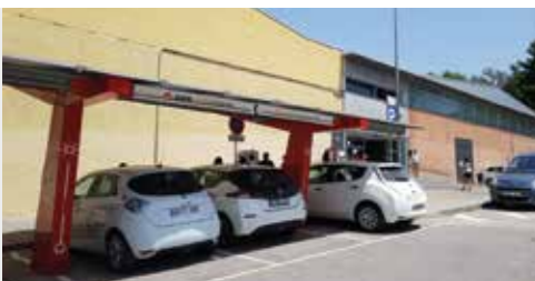
Fotolinera de Molins de Rei.